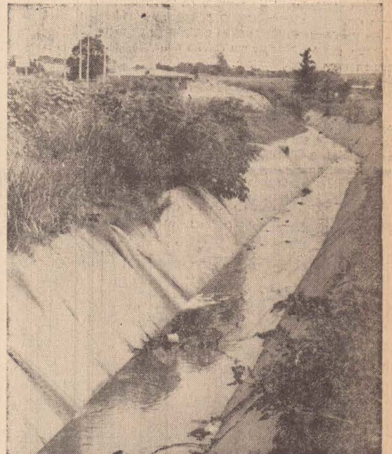
Agora, no Parque do Povo, as obras de limpeza, urbanização e paisagismo.

No trecho entre a avenida da Saudade e a rua Alvares Machado, que atualmente está sendo terraplanado e calçado nas margens da pista sul, serão construídas pistas para cooper e ciclismo. Ali o