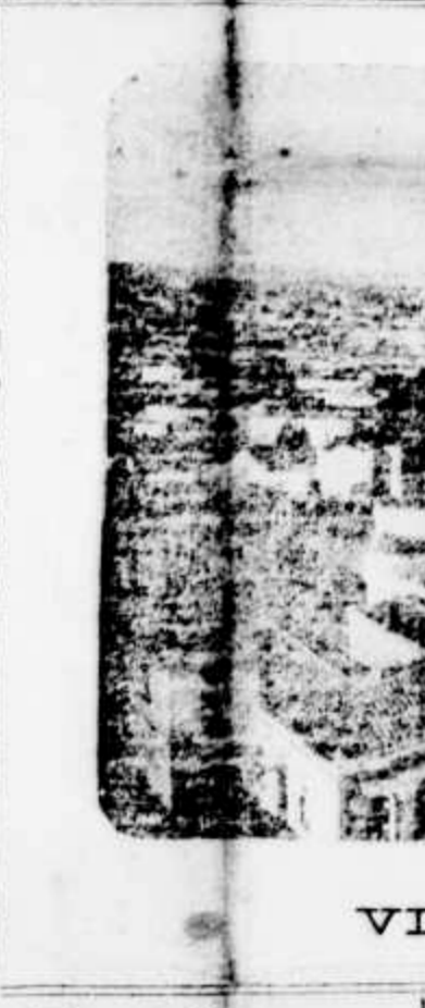
VILLA BUARQUE VISTA DO "MACKENZIE COLLEGE"