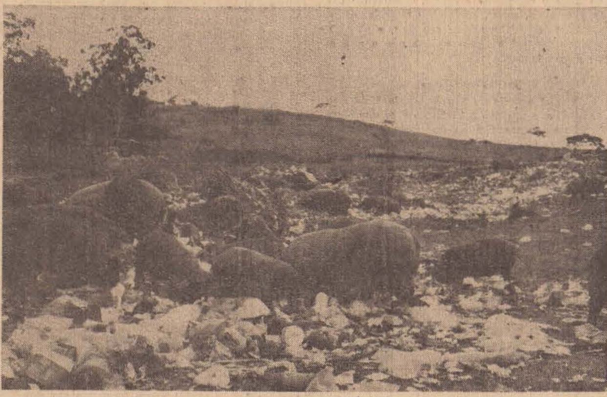
Os porcos se empanturram com o lixo de Presidente Prudente

O Sindicato Rural de Presidente Prudente já está trabalhando na organização da 13.ª Exposição de Animais — 3.ª Regional — a ter lugar no período de 5 a 14 de setembro próximo. Na última segunda-feira foi realizada a primeira reunião dos membros da Comissão Organizadora durante a qual foram tratados assuntos preliminares ligados à promoção. Pelo que se tem observado, está havendo grande interesse entre os expositores de Presidente Prudente e da região pelas inscrições, que serão abertas futuramente. A exposição de setembro deverá superar a do ano passado em número de animais inscritos, tendo em vista a ampliação dos pavilhões existentes no recinto. Por outro lado, a 13.ª Exposição de Animais — 3.ª Regional — de Presidente Prudente, oferecerá melhor comodidade aos expositores e ao público visitante, devido os melhoramentos introduzidos no recinto para a realização da V EXPOINEL em março último.