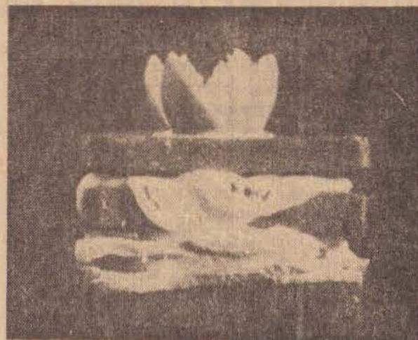
O sanduiche de 3 andares