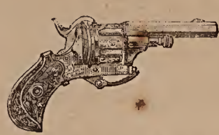
Desfauchaux-Revolver Kal. 7, 9 und 12 Millim. 8000 bis 20000