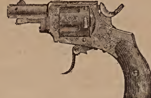
Centralfeuer-Revolver gewöhnliche und Extractors Kal. 320, 380 und 450 10000 bis 50000

von allen Sorten für Gewehre und Revolver.