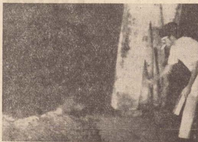
Fiscais da Delegacia da Receita atiram os pacotes no forno.

Foram incinerados 400 maços de Pall Mall, 80 de Kent, 520 de LM, 180 de Benson e 30 de Dunhill. O processo inclui outras mercadorias que serão levadas à leilão proximamente.