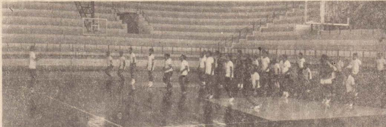
As aulas estão sendo ministradas no Ginásio Municipal de Esportes.

Enquanto aguarda o decreto presidencial que autoriza o funcionamento da Escola Superior Municipal de Presidente Prudente, a direção do estabelecimento, tendo em vista o aproveitamento do presente exercício, já iniciou as suas aulas. O ato presidencial tem constituído uma praxe, isto é, o de aprovar o funcionamento das escolas criadas depois de rigoroso processo a que são submetidas nos Conselhos Estadual ou Federal de Educação e no Ministério da Educação e Cultura que prepara o decreto para a assinatura do presidente da República.