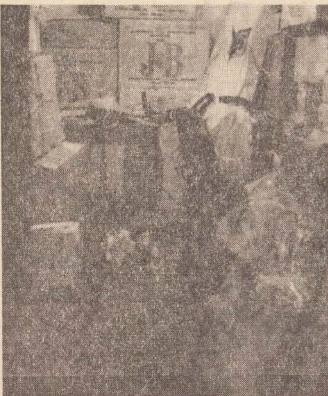
Estas mercadorias serão leiloadas.