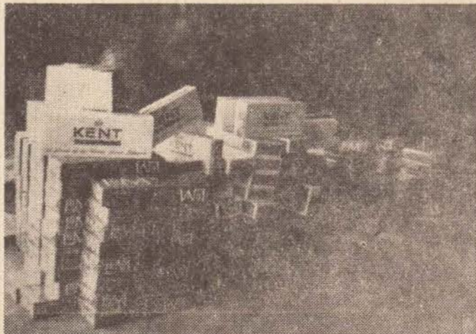
Os cigarros apreendidos em contrabando.