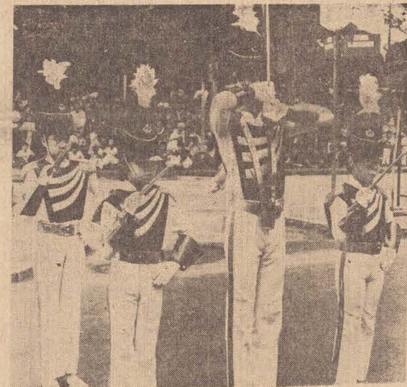
Criada há menos de um ano, a Banda Marcial da EEPG Soares Marcondes, já é comparada com a do Senac de Marília.

A pretensão é fazer com que a banda tenha em 1981 uma maior participação em todos os acontecimentos de Presidente Prudente