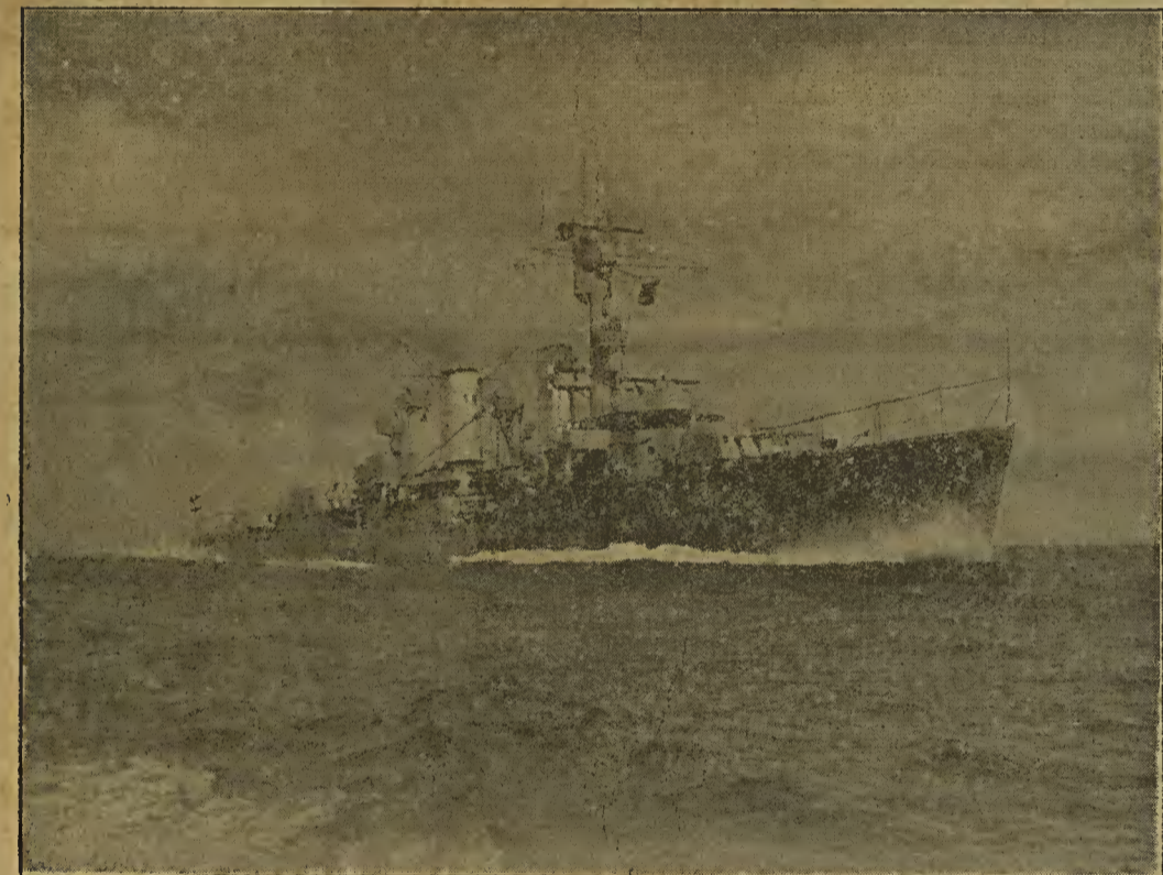
Zum Besuch des Kreuzers „Karlsruhe“

Das deutsche Volk hat erkannt, daß es in seiner Lage nur dann vor sich selbst und der Welt bestehen kann, wenn diese geistige Grundlage des Nationalsozialismus seine