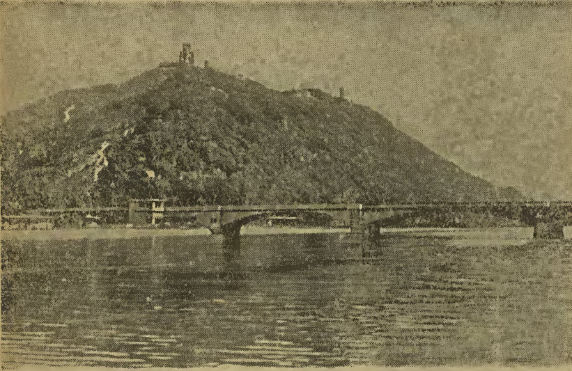
Links: Die berühmte Hohensyburg, der Schauplatz der großen Westfalenkundgebung, auf der Reichsleiter Rosenberg sprach.

stände abgestellt und Härten vermieden werden. Als vor kurzem Balduar v. Schirach seine Fahrt zur Jugend am Pflug unternahm, hat er neben der Besichtigung von Landhelfergruppen und Landjahrheimen auch die Eingliederung der Artamanenbewegung in die Hitlerjugend vorgenommen. Hier handelt es sich um wirkliche Pioniere der Schule. Seit Jahren haben sie, Kaufleute, Studenten, Jungarbeiter, das Hausfermer der Großstädte hinter sich gelassen und in Gruppen auf dem Lande gearbeitet. Ihr Gemeinschaftsgeist und ihre Arbeitskraft öffneten ihnen Tor und Hof. Die besonders gern gesehenen Arbeiter waren Artamanen. Und wo erst die „Männer des Ackerbaues“ ihren Einzug gehalten hatten, dort wehte bald das Banner