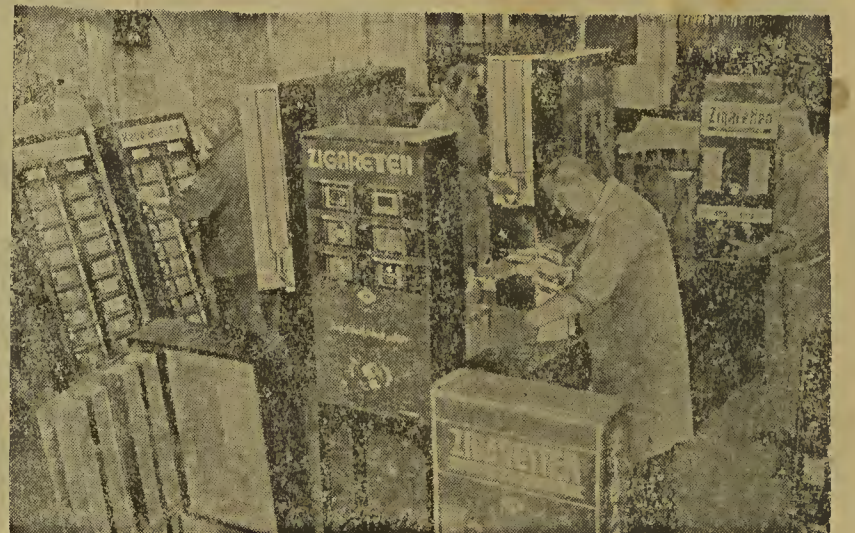
Rechts: Hochbetrieb in der Automatenindustrie. Nach dem Erlaß des neuen deutschen Automatengesetzes, das den Verkauf von Waren nach Geschäfts-schluß durch Automaten regelt, hat die Automatenindustrie einen gewaltigen Auftrieb erfahren. Unser Bild gewährt einen Blick in eine Automatenfabrik.

Unsere Leser würden uns entziehen, wenn wir ihnen bloß Nachrichten brächten. Wir würden, wenn man diesen Gedanken weiterspinn, auf die Dauer zu einer einzigen Zeitung für das gesamte Reichsgebiet kommen. Denn welchen Wert sollte man noch darauf legen, diesem völlig gleichmäßigen Nachrichtenmaterial eine besondere und jeweils verschiedene Aufmachung zu verleihen? Dann aber würde die Zeitung tot sein und nicht viel Berechtigung mehr haben, neben dem Rundfunk zu bestehen.