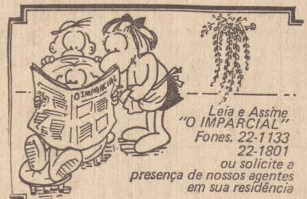
Leia e Assine "O IMPARCIAL" Fones. 22-1133 22-1801 ou solicite a presença de nossos agentes em sua residência