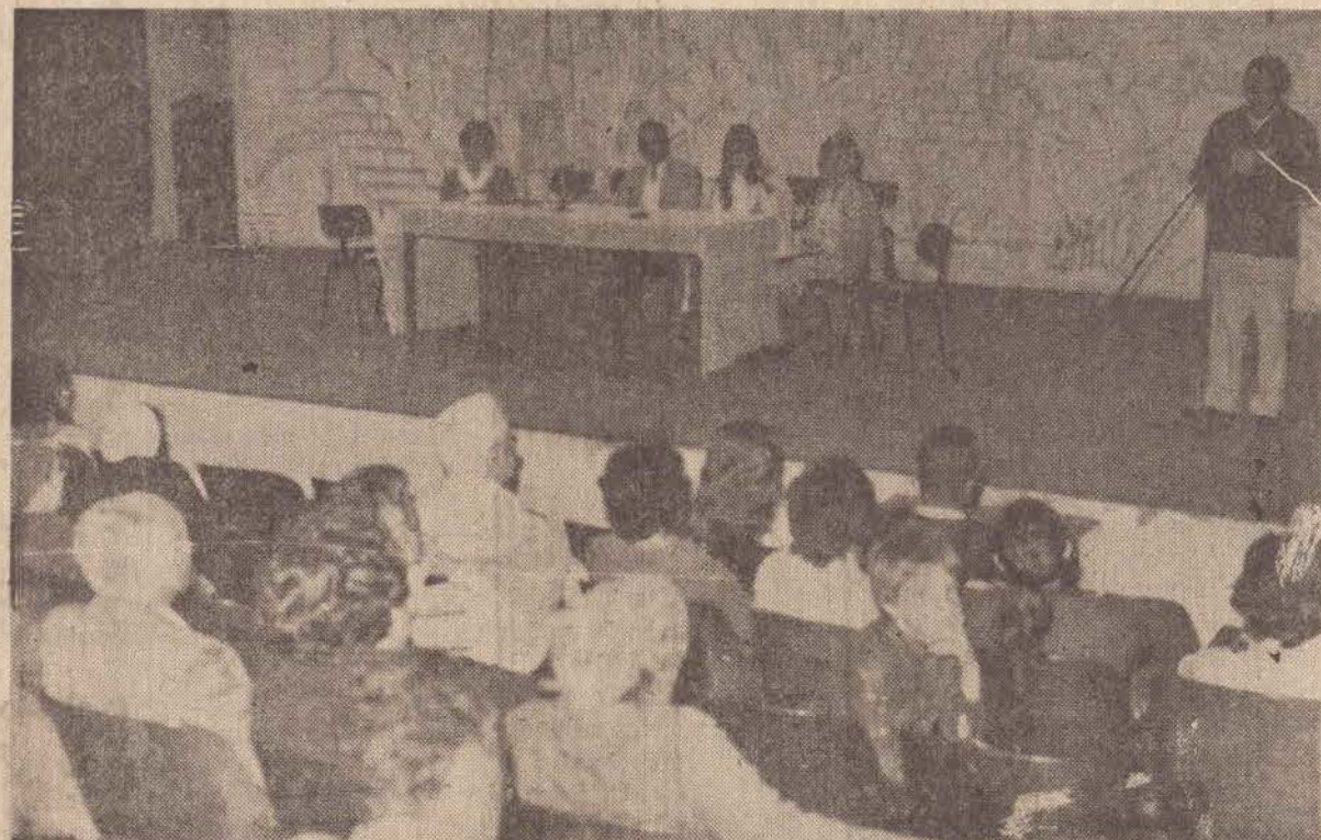
Foi homenagem a todos que participam de programas sociais, atuando na comunidade