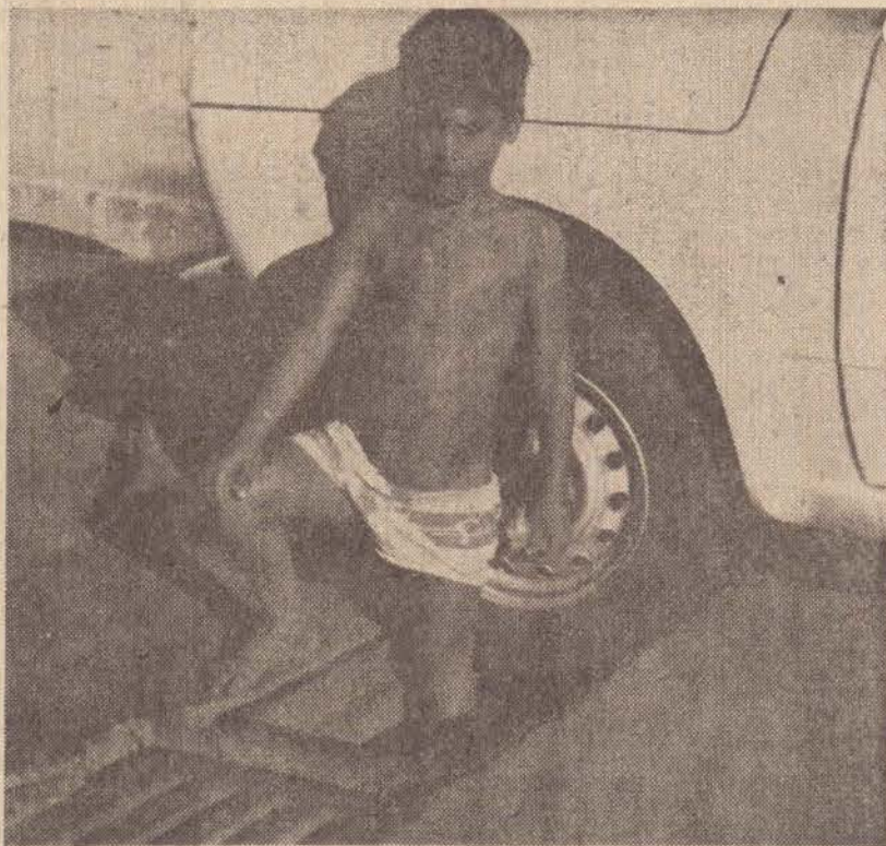
O pneu do carro e o tamanho da criança dão uma idéia do perigo. Faltam os tampões dos quatro buracos abertos