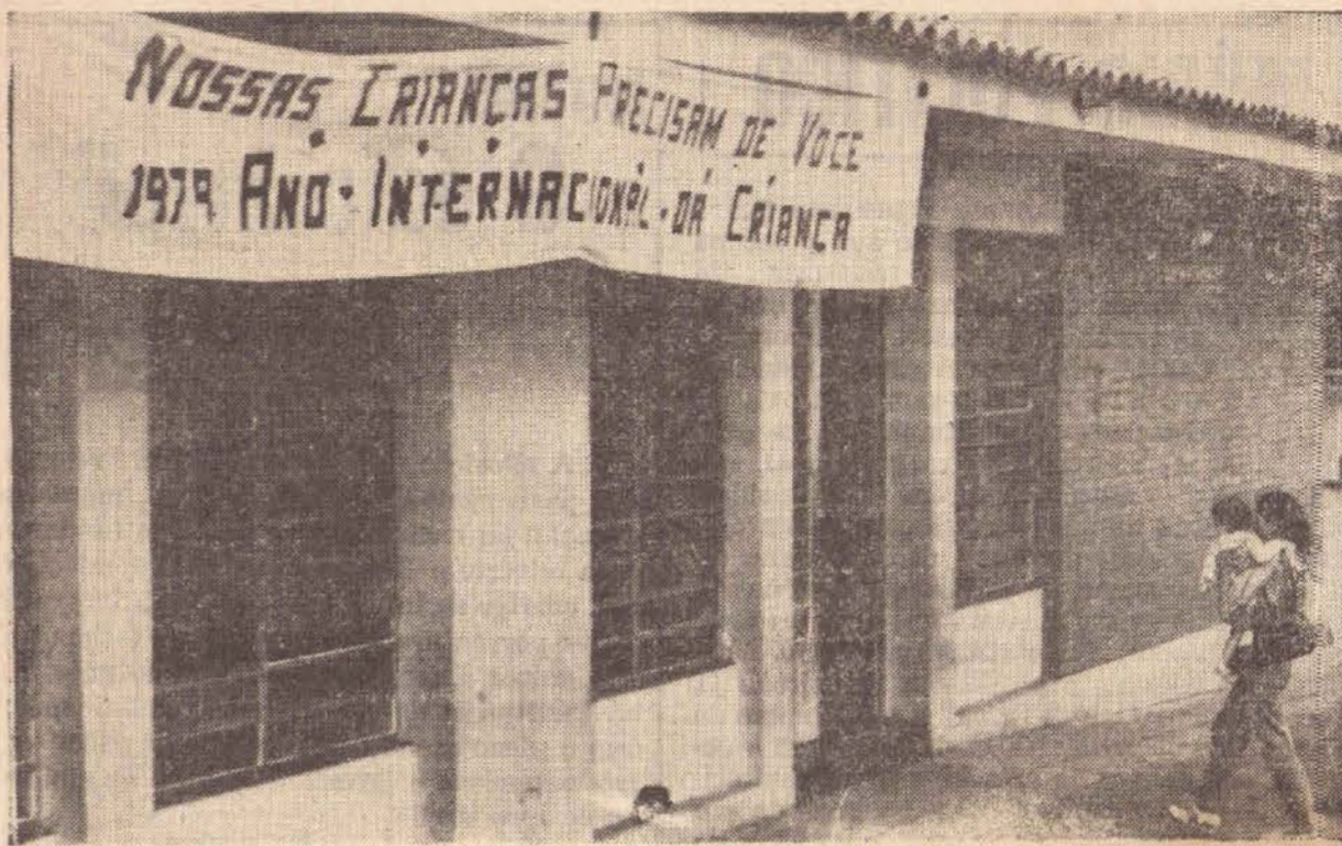
A chegada das mães-todas as manhãs, com suas crianças, para poderem desempenhar seus trabalhos profissionais fora de casa.

• Em nossa mesa o número 15 do "Pingo". Nossos agradecimentos.