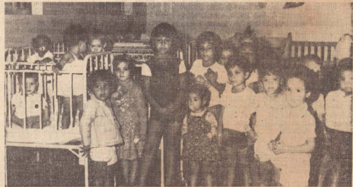
O reencontro diário acaba criando um clima de solidariedade entre as crianças.