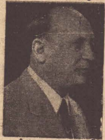
O Dep. Domingos Leonardo Cerávolo, que incansavelmente vem labutando na Assembléia em favor desta nossa exuberante região

2) — O trabalho externo será normal em consequência da situação calamitosa em que se encontra o Município; 3) — Serão hasteadas, no Paço Municipal as Bandeiras Nacional e Paulista. Presidente Prudente, 24 de janeiro de 1961. Dr. José Amândo de Queiroz Telles Procurador Judicial