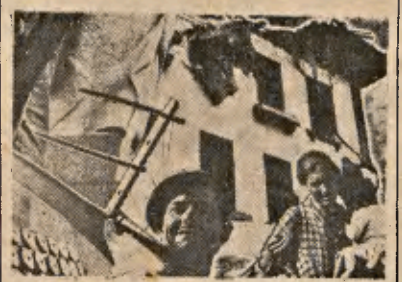
...angustia de los vencidos...

En cerca de tres años de lucha infrahumana el anarquismo español lo dio todo. Su gallardía y sus hombres, sus conocimientos, ¡y hasta el momentáneo abandono de sus más caros principios! Resultó en vano. Los anarquistas