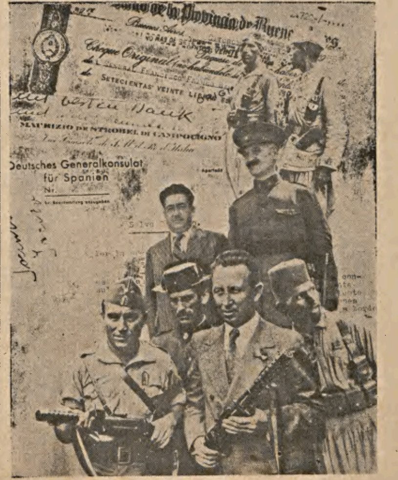
...la fuerza bruta, el bestialismo político...

diversos núcleos. Cada uno de ellos necesita informaciones objetivas de los demás para que la actuación del conjunto sea en todo momento fiel reflejo del momento his-