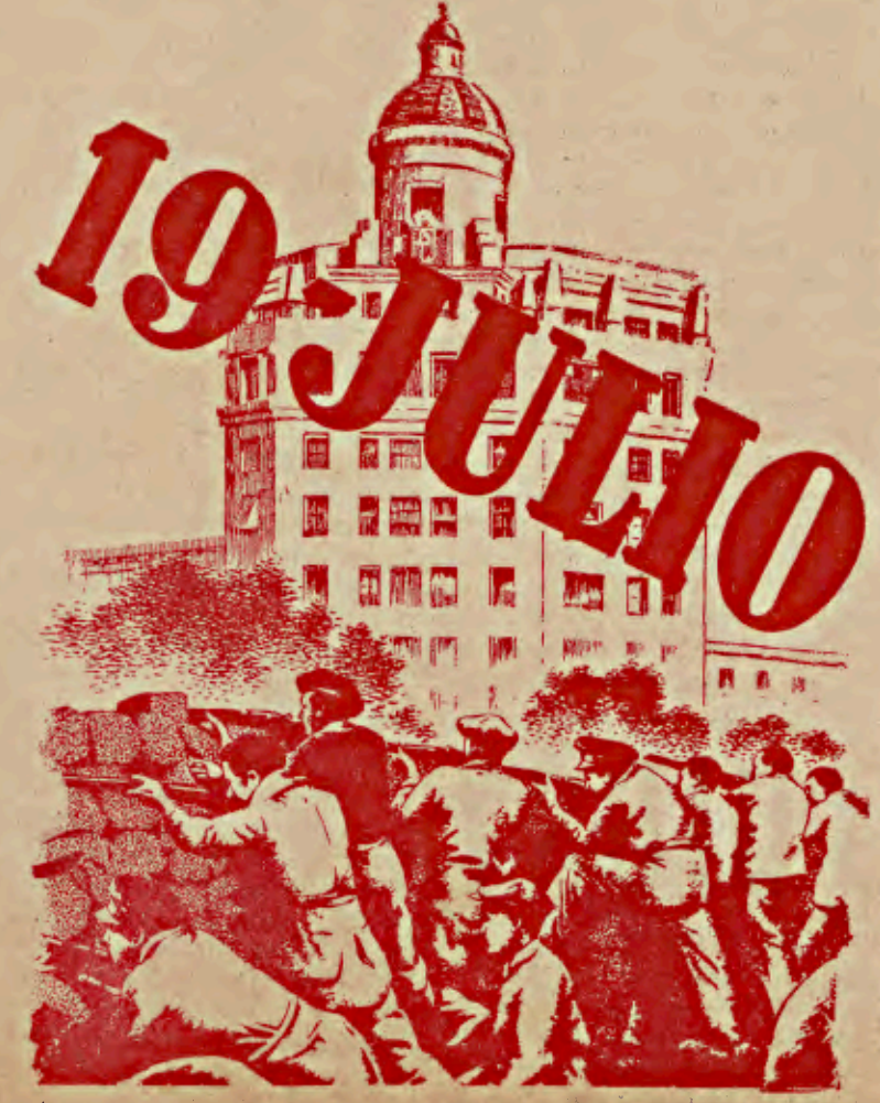
...cátedra de dignidad y coraje...

En el drama de Occidente por encontrar una tercera dimensión que nos sacuda de los dos bloques monolíticos en que se ha erigido la humanidad, seguirá siendo necesario que el mundo de los hombres sepa digerir fechas como las del 19 de Julio en la España convulsionada de 1936; entonces las esperanzas de libertad en Iberia serán realidad y no deseo. En ello se unirán las esencias de españoles muertos hace siglos y de los que regaron su sangre hace pocos años. Será un concepto trascendente de libertad. Entonces los hombres sabrán que se puede ser libre.