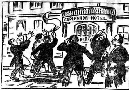
Qual devia ser a resposta do pessoal que trabalha neste estabelecimento? — Trabalhai vós, insaciáveis abutres!

Confirmando a nota por nós inserta no numero anterior, voltamos de novo a tratar do caso do Esplanada Hotel. Obrigados por alguns jornaes burguezes que no intuito de auferirem lucros, não trepidam em desvirtuar os factos, dando-lhes um caracter muito diferente da propria realidade.