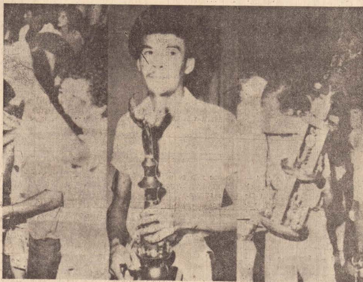
Acima, a festa dos integrantes da Vila Dubos. Em baixo, a alegria dos troféus e a fúria dos protestos.