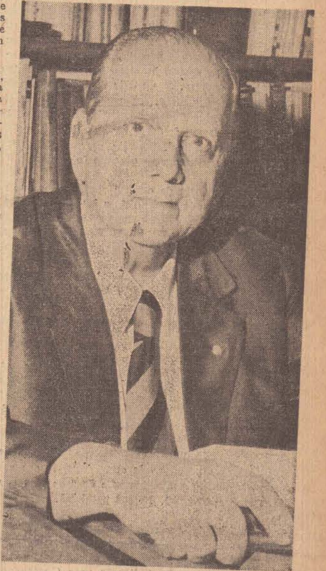
Um homem experiente no campo da promoção humana

O Secretário da Promoção Social, Mário de Moraes Altenfelder desembarcará hoje, às 17h30 em Presidente Venceslau onde permanecerá até amanhã. Hoje a noite será homenageado com um jantar, de que participarão as autoridades da região administrativa de Presidente Venceslau e dos representantes das entidades de assistência social.