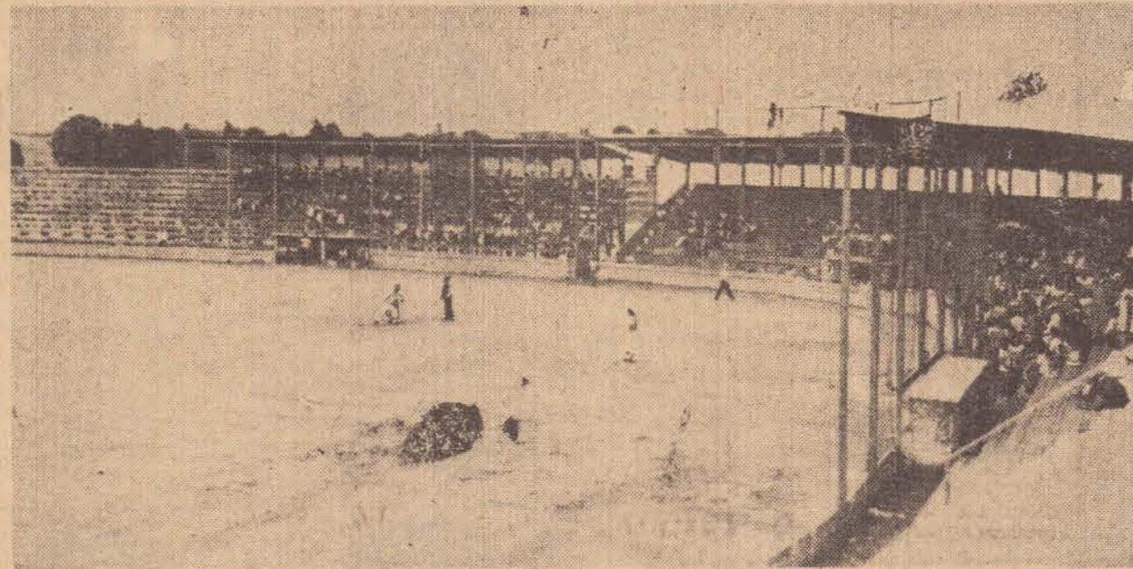
Uma vista do estádio de "Base-Ball" de Presidente Prudente, num dia de partida. Amanhã, ele estará novamente com grande público.

O campeonato terá inicio as 8 horas, a ENTRADA É FRANCA, o que significa que todos aqueles que gostam desse esporte, deverão comparecer, assistindo, os espetáculos, pois as partidas de "Base-Ball", são bastantes interessantes esporte realmente que apela a zona.