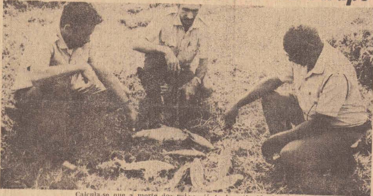
Calcula-se que a morte dos peixes já tenha atingido 1 tonelada

"Art. 37 — Os afluentes das redes de esgotos e os resíduos líquidos ou poluídos das industrias, somente poderão ser lançados às águas quando não as tornarem poluídas"