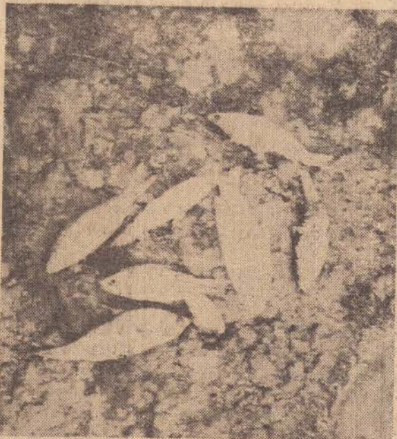
Este crime precisa ser apurado

"Art. 37 — Os afluentes das redes de esgotos e os resíduos líquidos ou poluídos das industrias, somente poderão ser lançados às águas quando não as tornarem poluídas"