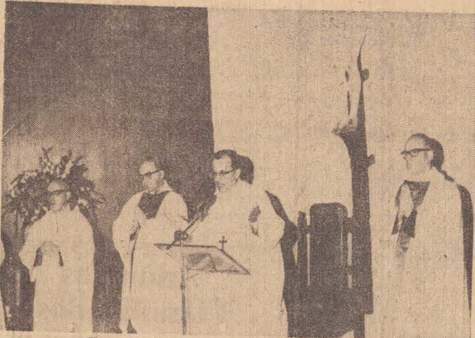
Uma solenidade como a da foto, foi repetida quarta-feira no Seminário Diocesano.

Dia 8 de agosto, domingo encerrando a Semana, palestras em todas as Santas Missas, ainda sobre a vocação, e sua oferta nesta missa, deverá ser mais generosa, pois será destinado ao Seminário Diocesano.