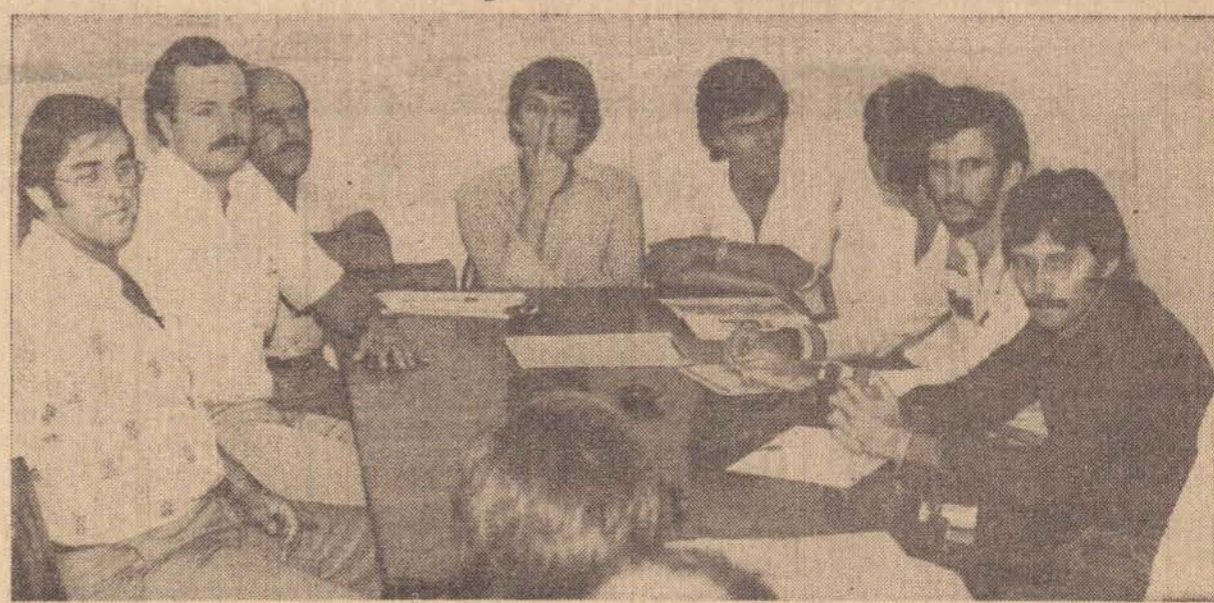
Aspectos da reunião de abertura das propostas oferecidas por cinco empreiteiras.

as obras não haviam sido iniciadas. Imediatamente convocou ao seu gabinete o Superintendente do DER, dando-lhe ordens expressas para que essas obras sejam iniciadas imediatamente.