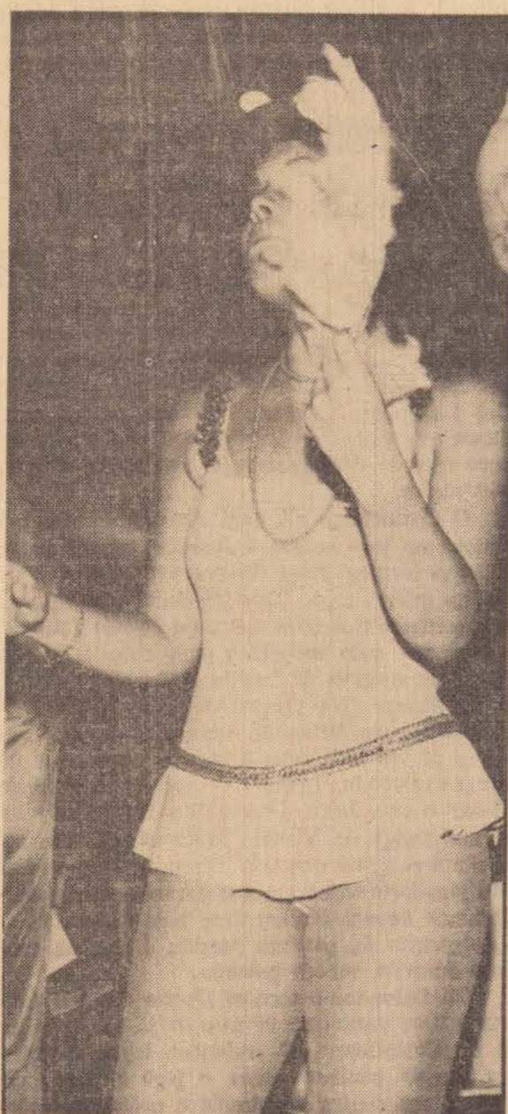
Tem Pena Pra Atrapalhar