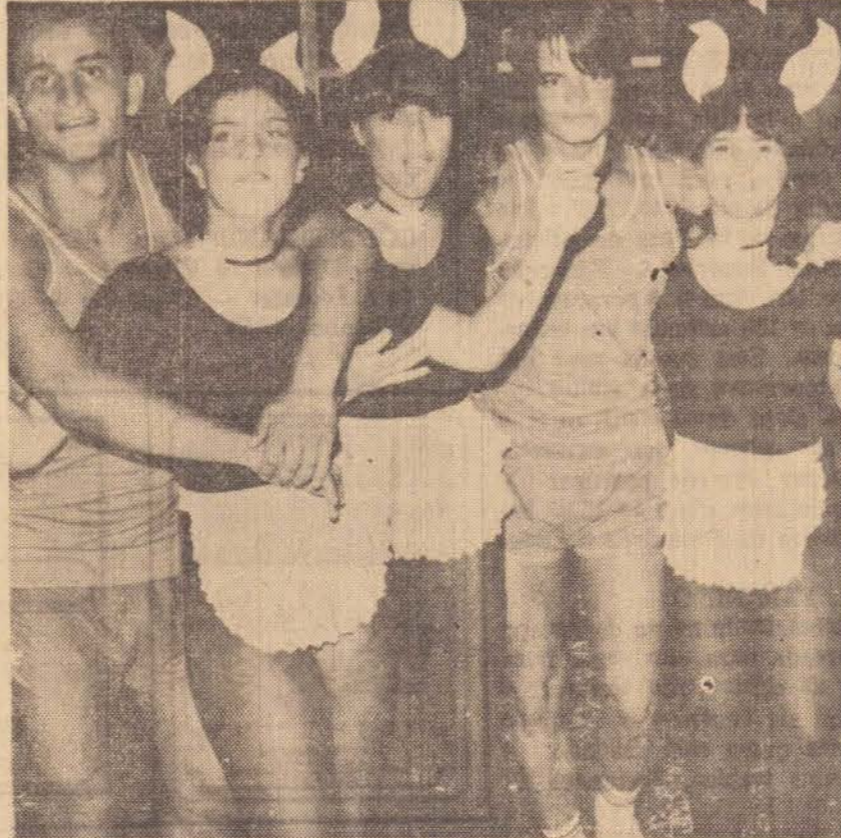
Trabalho Pro Patrão