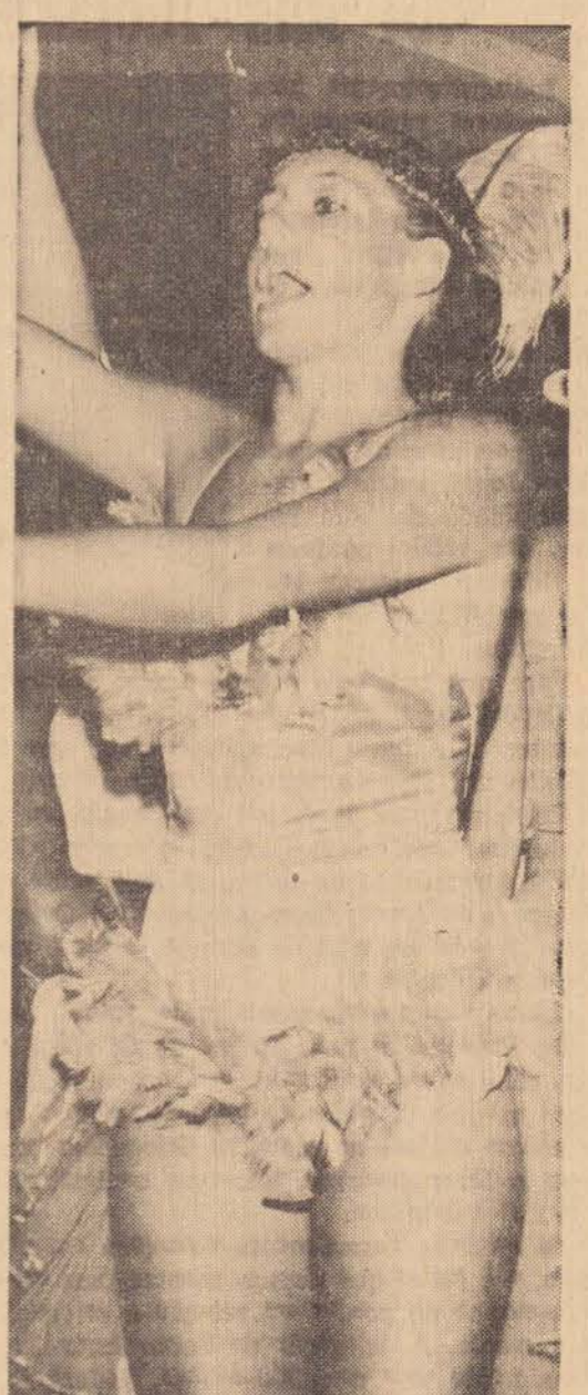
Ala La ô, ô, ô,