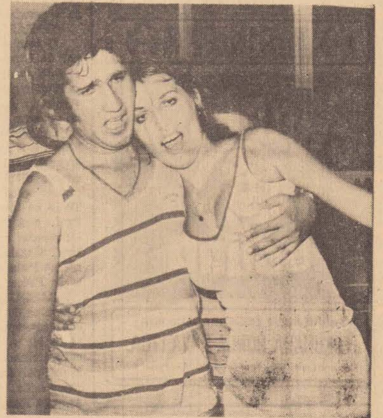
Afinando a Musica