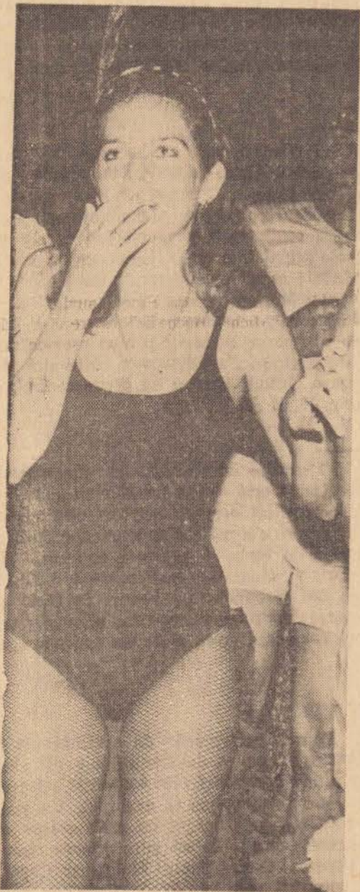
Como é aquela musica mesmo?