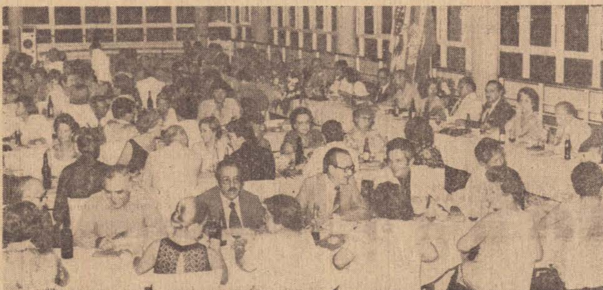
Um aspecto do jantar, com quase duzentas pessoas presentes, numa perfeita confraternização.