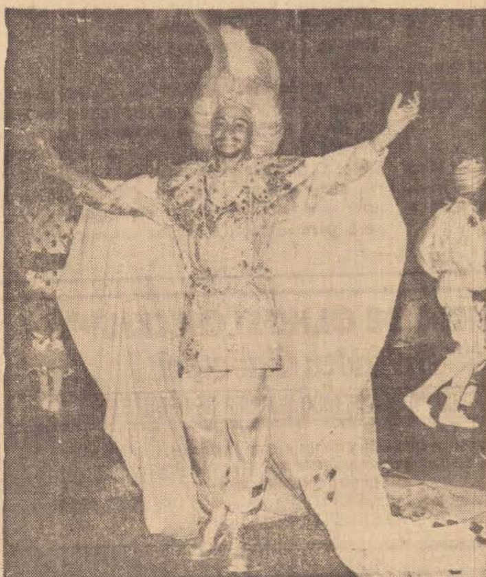
As mil e uma Noites