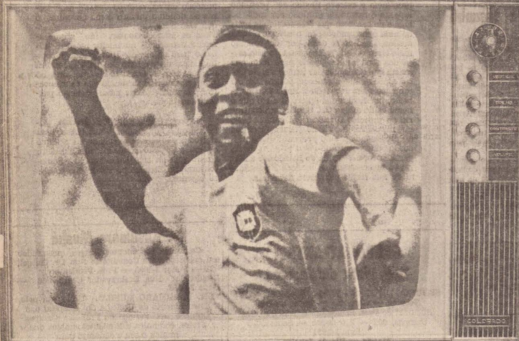
Mod. CO 7 de 24"