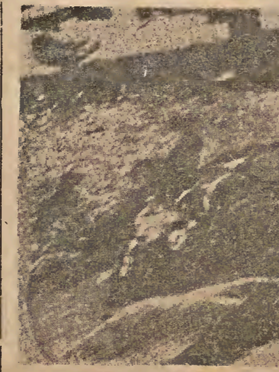
...cuerpo de Francisco Sabater.

La muerte de los hombres y las luchas de los pueblos son cosas serias. ¡No se puede ju-