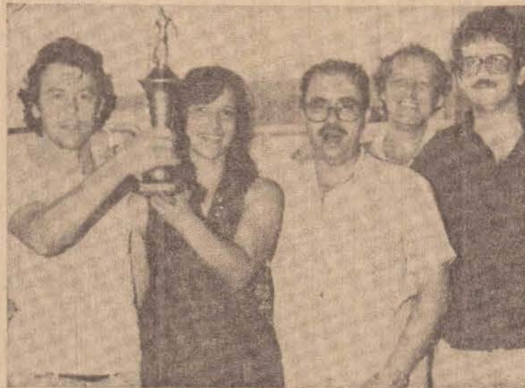
A competição esportiva, despertou muita euforia.