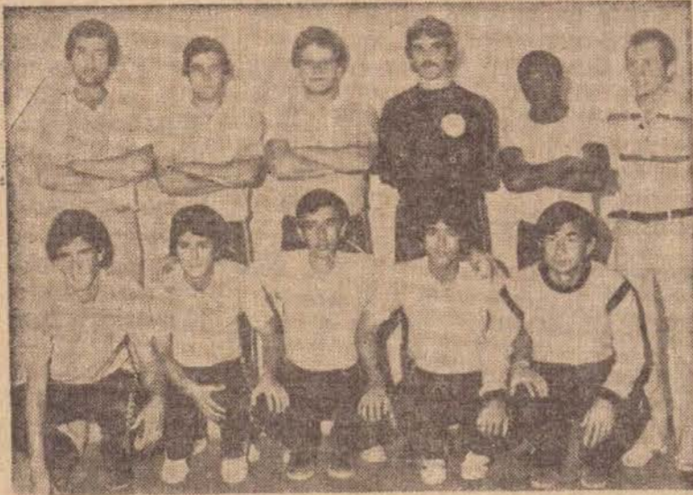
Equipe do Ipanema Clube que participou do Campeonato Paulista de Fut-Sal.

A diretoria do Ipanema Clube de Pres. Prudente, ao resolver incluir o nome do Clube entre os demais que disputam o Campeonato Paulista de Futebol de Salão, promovido pela Federação Paulista de Futebol de Salão, tinha por objetivo a divulgação do clube e a aquisição de experiência para outros campeonatos. Os objetivos foram alcançados, quando foi divulgada a tabela oficial da Federação Paulista de Futebol de São, com quatro equipes, sendo que somente duas se classificariam e existiam duas da capital, sabíamos que a classificação do Ipanema Clube seria difícil.