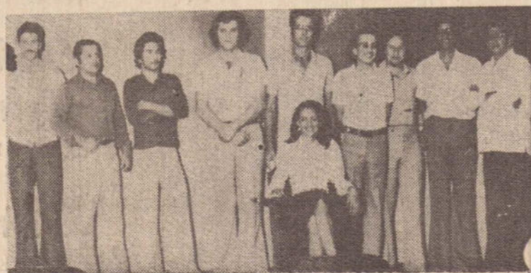
Na foto os acadêmicos que compõem a chapa do M.A.R.

A chapa Movimento Acadêmico Renovador vem realizando um intenso trabalho para aliciar os votos dos companheiros, certa de, uma vez eleita, realizará um bom trabalho em favor daquela entidade. Segundo seu programa, o M.A.R. propugnar pela defesa dos interesses dos acadêmicos, integrando-os e o-