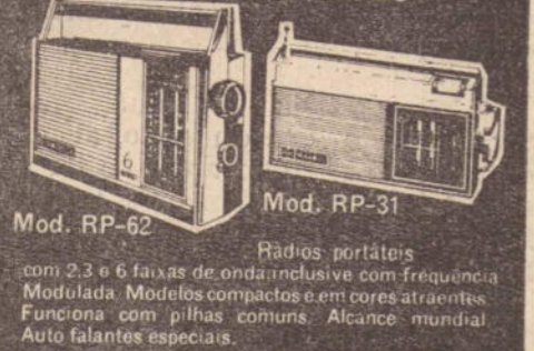
Mod. RP-62 Rádio portátil com 2,3 e 6 faixas de ondas inclusive com frequência Modulada. Modelos compactos e em cores atraentes. Funciona com pilhas comuns. Alcance mundial. Auto falantes especiais. Mod. RP-31 Rádio portátil com 2,3 e 6 faixas de ondas inclusive com frequência Modulada. Modelos compactos e em cores atraentes. Funciona com pilhas comuns. Alcance mundial. Auto falantes especiais.

O Campeonato da Segunda Divisão de Profissionais talvez recomece a ser disputado em novembro. De momento, está ele suspenso em virtude de processos que estão em andamento no TJD e de cujas decisões depende a classificação numa das séries. Espera-se que na próxima semana esses casos sejam decididos e então o Departamento Técnico terá condições de elaborar a tabela da nova fase.