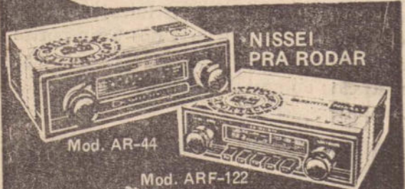
Mod. AR-44 Rádio para carro com 4 faixas de ondas de alcance mundial. Sintonia manual ou automática. FM/AM/49/31/25 ms. Potência de 5 watts, sem distorção e isento de ruídos e interferência. Totalmente transistorizado. Mod. ARF-122 Rádio para carro com 4 faixas de ondas de alcance mundial. Sintonia manual ou automática. FM/AM/49/31/25 ms. Potência de 5 watts, sem distorção e isento de ruídos e interferência. Totalmente transistorizado.

O Campeonato da Segunda Divisão de Profissionais talvez recomece a ser disputado em novembro. De momento, está ele suspenso em virtude de processos que estão em andamento no TJD e de cujas decisões depende a classificação numa das séries. Espera-se que na próxima semana esses casos sejam decididos e então o Departamento Técnico terá condições de elaborar a tabela da nova fase.