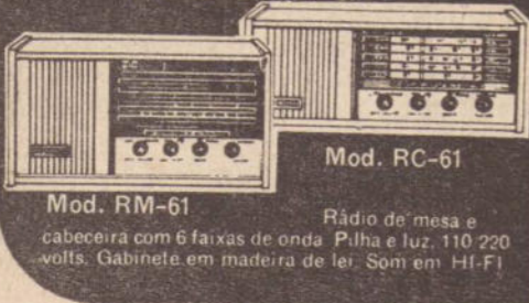
Mod. RC-61 Rádio de mesa e cabeceira com 6 faixas de onda P, H e L; 110 220 volts. Gabinete em madeira de lei. Som em HI-FI Mod. RM-61 Rádio portátil com 2,3 e 6 faixas de ondas inclusive com frequência Modulada. Modelos compactos e em cores atraentes. Funciona com pilhas comuns. Alcance mundial. Auto falantes especiais.

Escrinho, do Internacional, no jogo 1 contra o Corinthians, aos 4-45 minutos, e Pio, do Santa Cruz, no jogo 3 contra o Palmeiras, aos 89-30 minutos, os prováveis vencedores do concurso de gols da Caixa Econômica Federal no teste 258 da Loteria Esportiva. Escrinho no gol mais rápido e Pio no último gol. Após os levantamentos das súmulas, entregues pelos árbitros que estiveram em ação nos jogos do teste, se saberá oficialmente quem vai receber o prêmio de 2 mil cruzeiros.