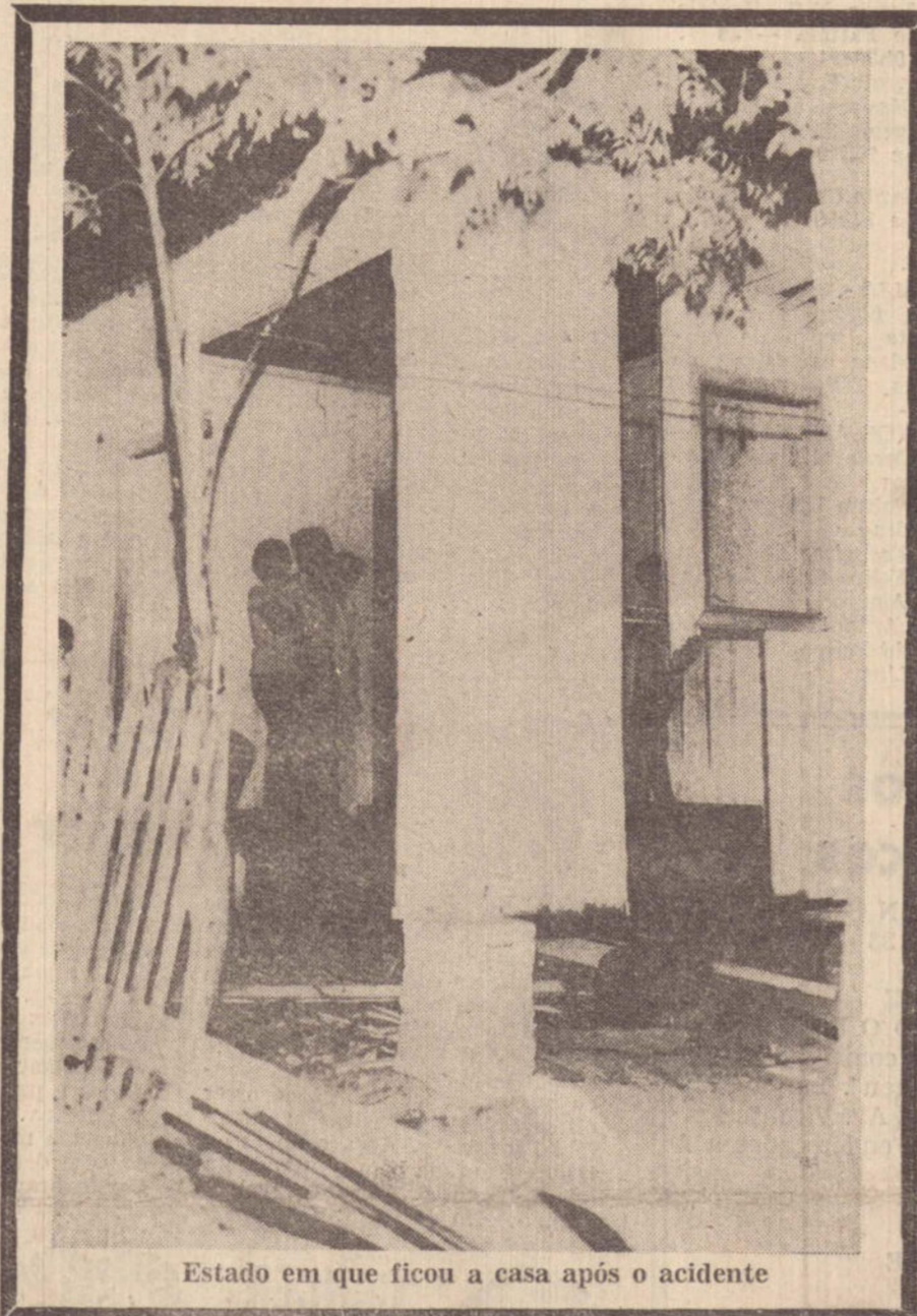
Estado em que ficou a casa após o acidente