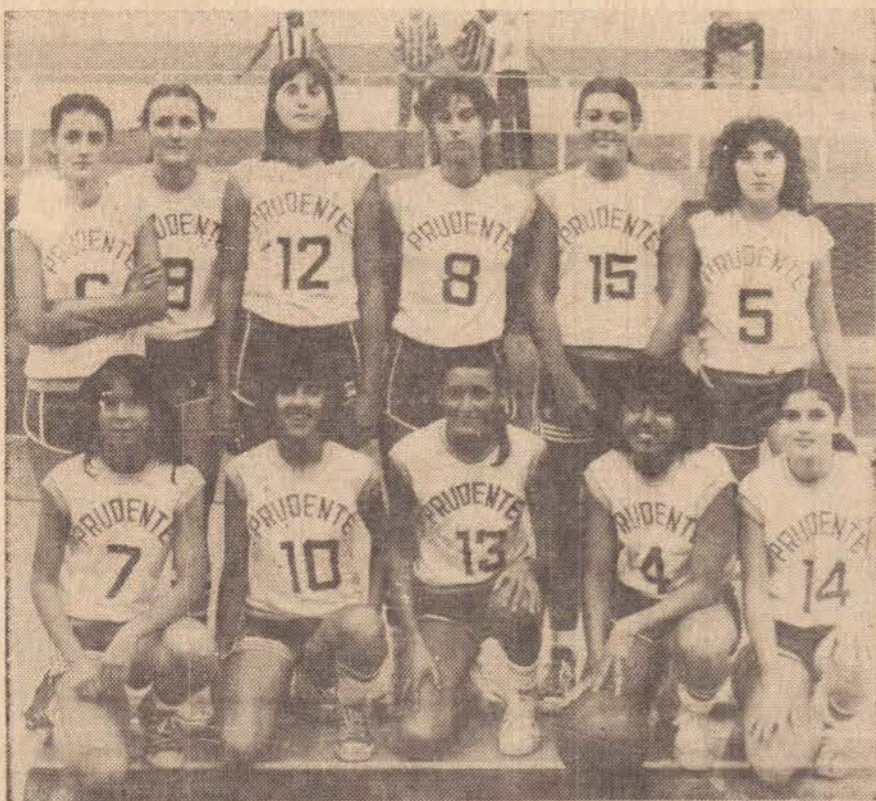
Equipe de basquetebol feminino

Presidente Prudente ocupa hoje uma posição de destaque em todo Estado de São Paulo crescendo populacionalmente, desenvolvendo industrial e comercial, uma grande metamorfose administrativa,