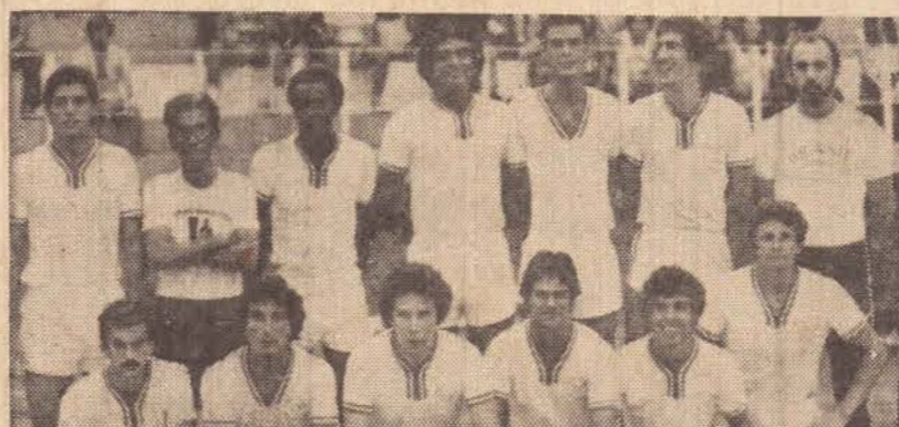
Equipe de voli masculino