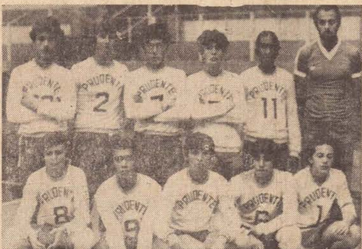
Equipe de voli infanto-juvenil