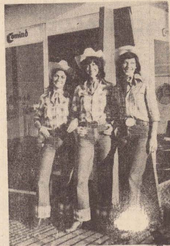
As recepcionistas do COMIND que atenderam à clientela durante a mostra.