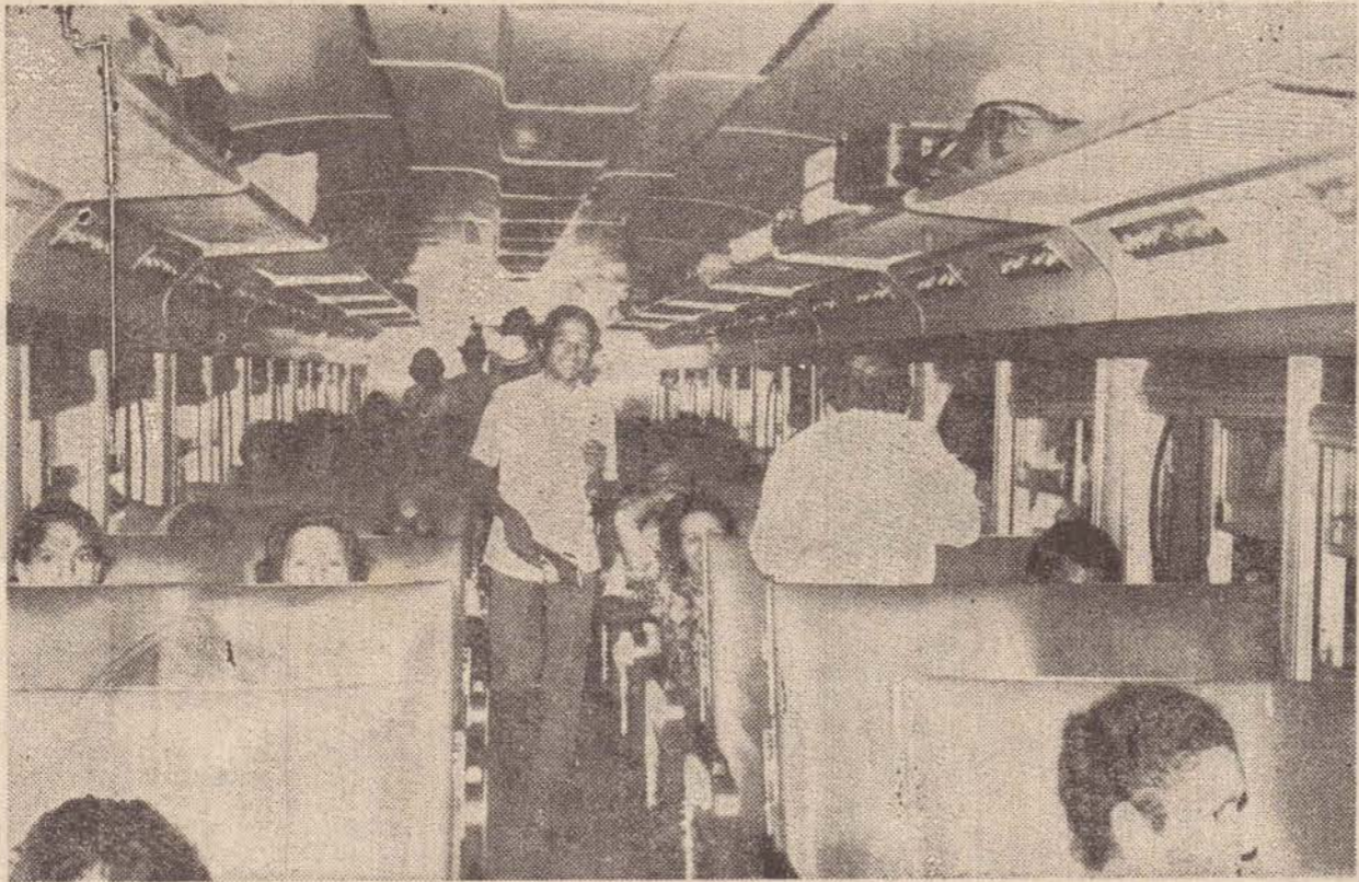
No interior dos vagões haviam muitos lugares vazios.