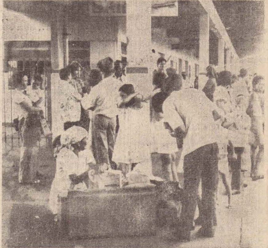
Havia pouca gente aguardando o trem de ontem na estação da Fepasa.