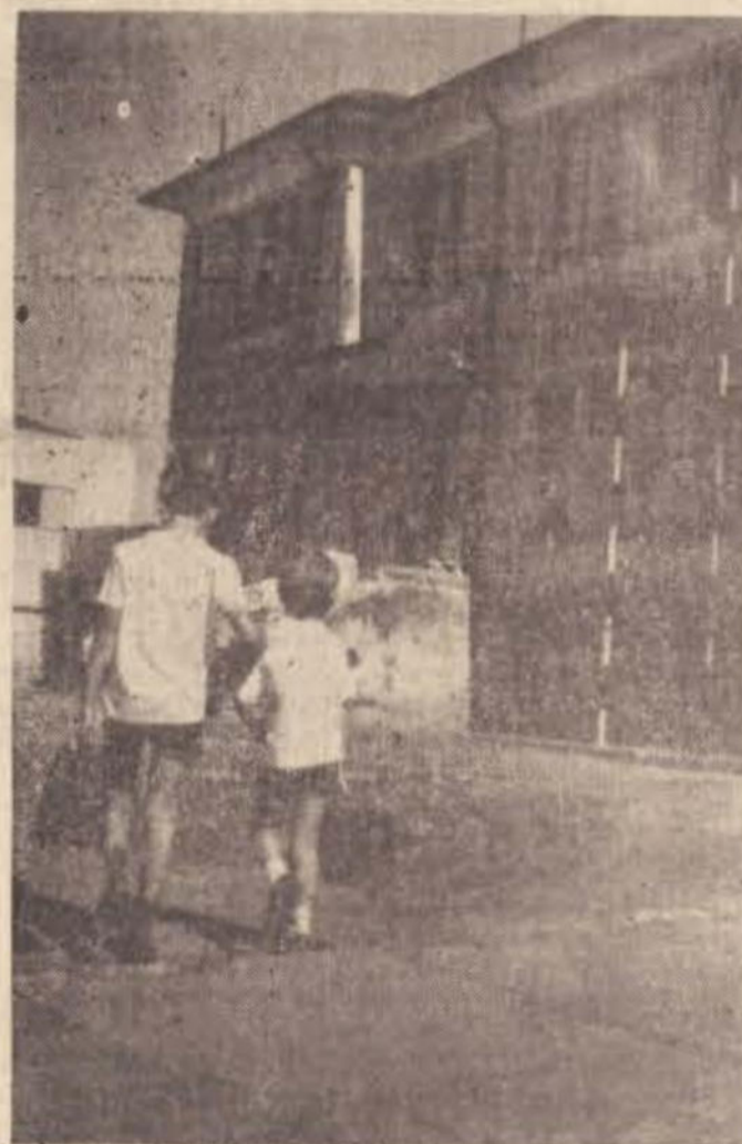
E' O COMEÇO DO SEGUNDO TURNO ESCOLAR DE 1972.

A cidade ganhou maior movimentação nas ruas desde as primeiras horas da manhã de ontem com o reinício das aulas em todos os estabelecimentos de ensino. Segundo informações nas