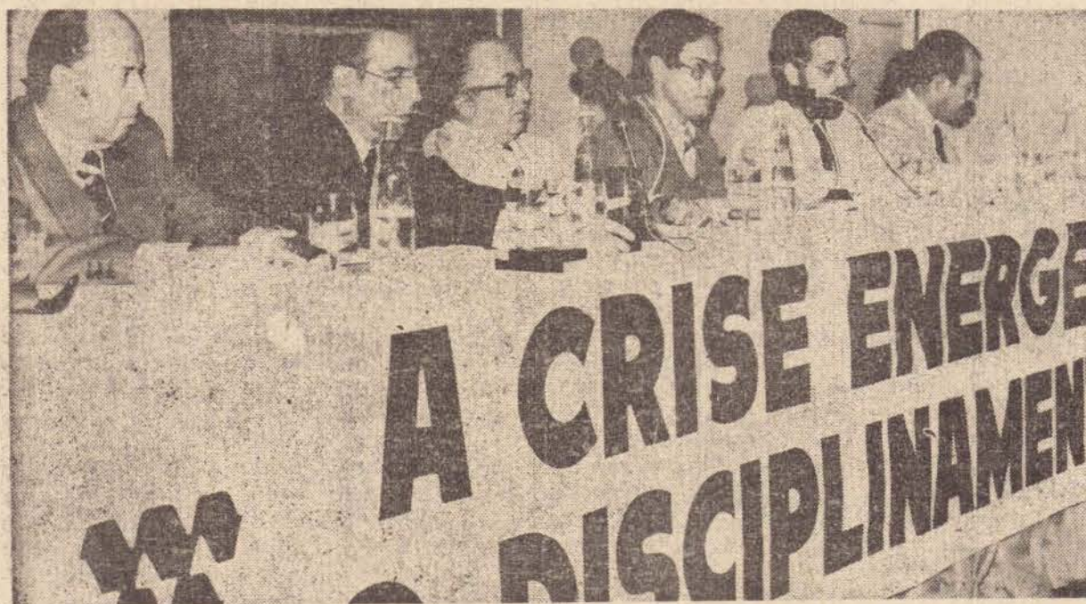
A mesa principal que dirigiu os trabalhos durante a apresentação do painel, na parte da tarde.