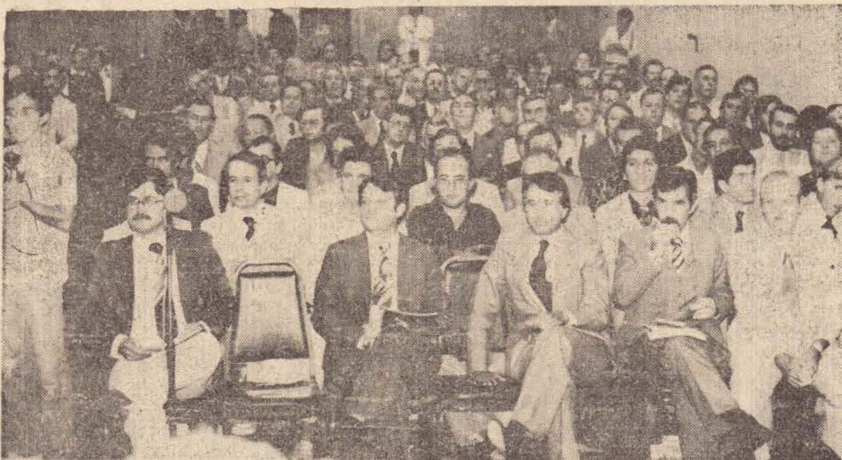
Vista da assembléia, lotando as dependências do auditorio do Maksoud Plaza Hotel.