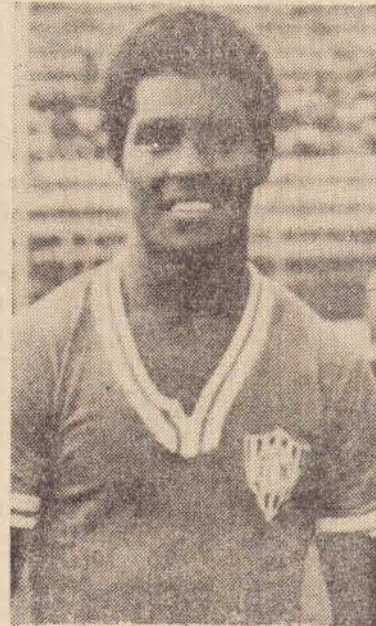
Lela revelação do Noroeste

O apronto para o amistoso de amanhã a noite, será na manhã de hoje, quando os atletas mosqueteiros realizarão um leve ensaio de conjunto ficando definida a equipe mosqueteira.