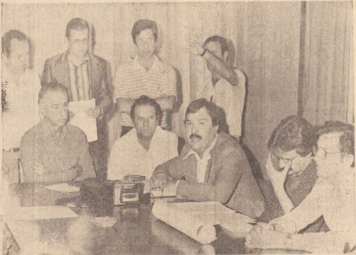
Diretores do Senac, explicaram ontem às autoridades que a instituição atravessa "séria crise econômica".