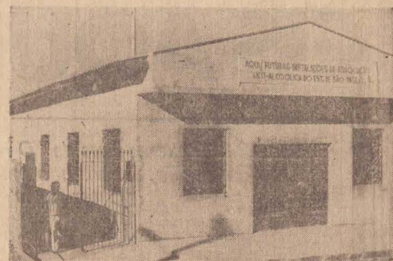
A nova sede da Associação Antialcoólica em fase final de acabamento.

Todos os elementos recuperados, são hoje pessoas que trabalham, produzem, pagam tributos e cumprem suas obrigações junto a comunidade. Agora a Associação Antialcoólica do Estado de São Paulo, a sede Regional de Pres. Prudente está se expandindo, já funcionando na cidade com cinco núcleos além da regional. São os núcleos do Hospital Bezerra de Menezes Centro Comunitário do Jardim Guanabara, Centro Comunitário da Igreja de São Pedro, da Vila Formosa e da Cohab. Também está sendo construída a sede própria a rua Lauro Queiroz, 241 na Vila Comercial, onde funcio-