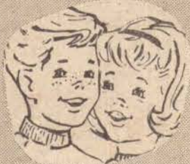
Quem dá Philishave ao papai "adivinha" o seu desejo