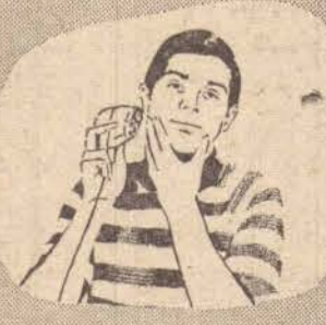
Quem ganha um Philishave "descobre" um hábito jovem.

Hoje, barba se faz com o barbeador elétrico