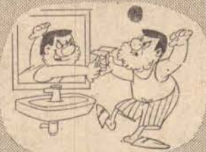
Para que ele não duela mais com a barba