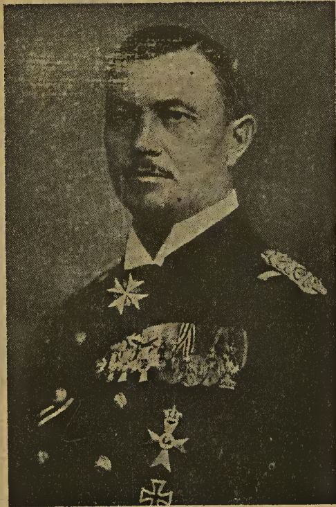
Admiral Scheer der Sieger vom Skagerrak

entsandte ein Torpedoboot, um festzustellen, was für ein Wrack das sei. Beim Herankommen las der englische Kommandant aus nächster Nähe am Heck den Namen „Invincible“, die Unbesiegbare. Nur sechs Mann von 1032 wurden gerettet. Als sich die Nacht auf das Schlachtfeld herabsenkte, ver-