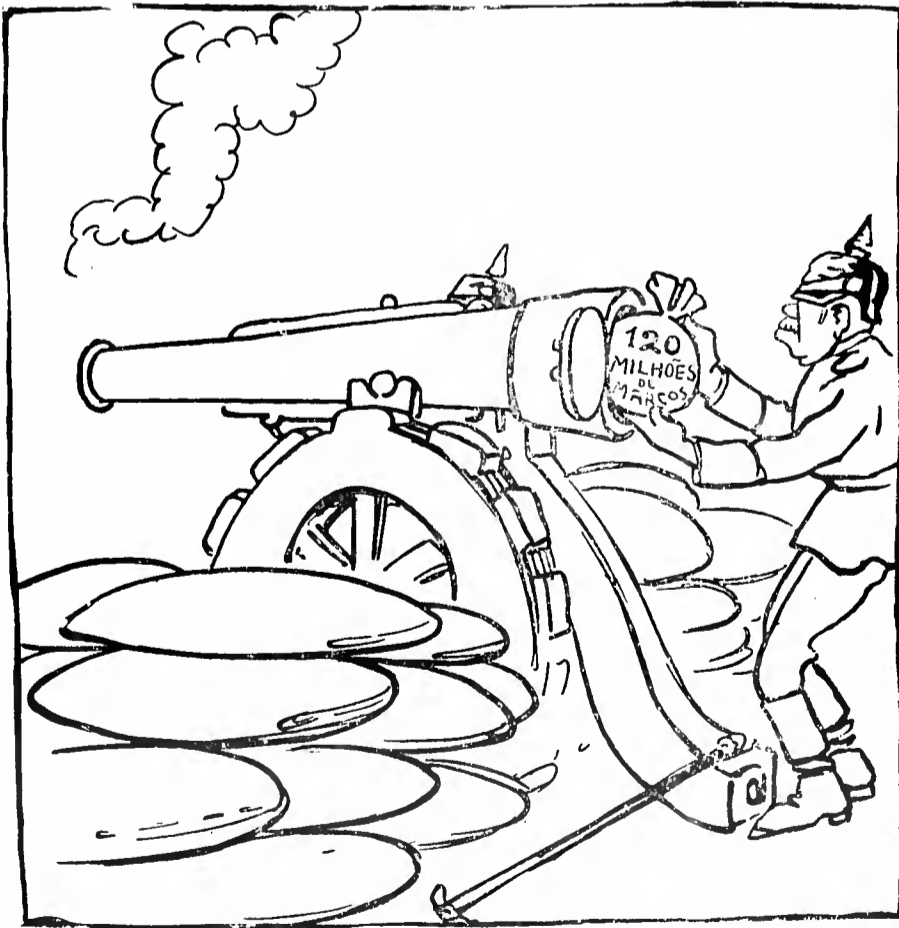
Deposito do dinheiro pertencente ao Brasil