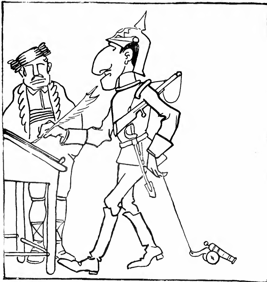
AFFONSO XIII — Tranquillisem Portugal...

gancia finissima e um não sei que de extranho e vago, que chega a parecer emoção