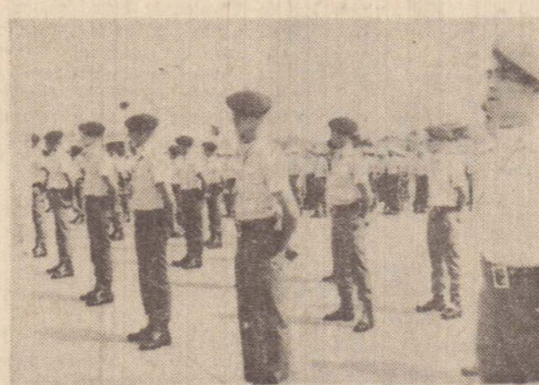
Os novos soldados incorporados à PM