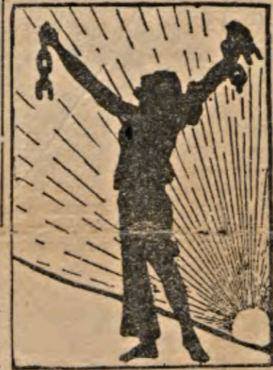
... podrán lograr la verdadera libertad de los pueblos.

Se cuenta que durante la pasada guerra llegó a un país de latino américa un general europeo que tomaba activisi-