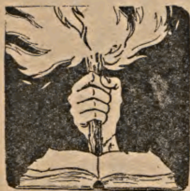
Sólo los hombres que piensan y tienen aspiraciones...

EN la América Latina se suceden los cuartelazos con una prodigalidad asombrosa. Y es que nuestros generales, faltos del "lustre" que se conquista en los campos de batalla, pretenden inmortalizar su nombre entrando a saco en las exiguas libertades que de vez en cuando disfrutaban los pueblos en