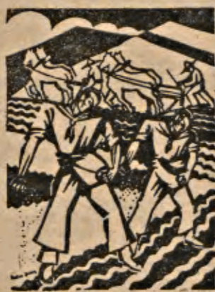
... los hombres que trabajan y aman la vida...

La última militarada ha tenido lugar en Venezuela. Rómulo Gallegos, presidente de aquel país, a la vez que uno de los mejores escritores del Continente, tuvo que abandonar el poder y expatriarse como consecuencia de uno de los peculiares ataques de los discípulos de Marte. Rómulo Gallegos es un hombre liberal. No ignora el dolor y la miseria del pueblo, y quizá creyó que desde el poder po-