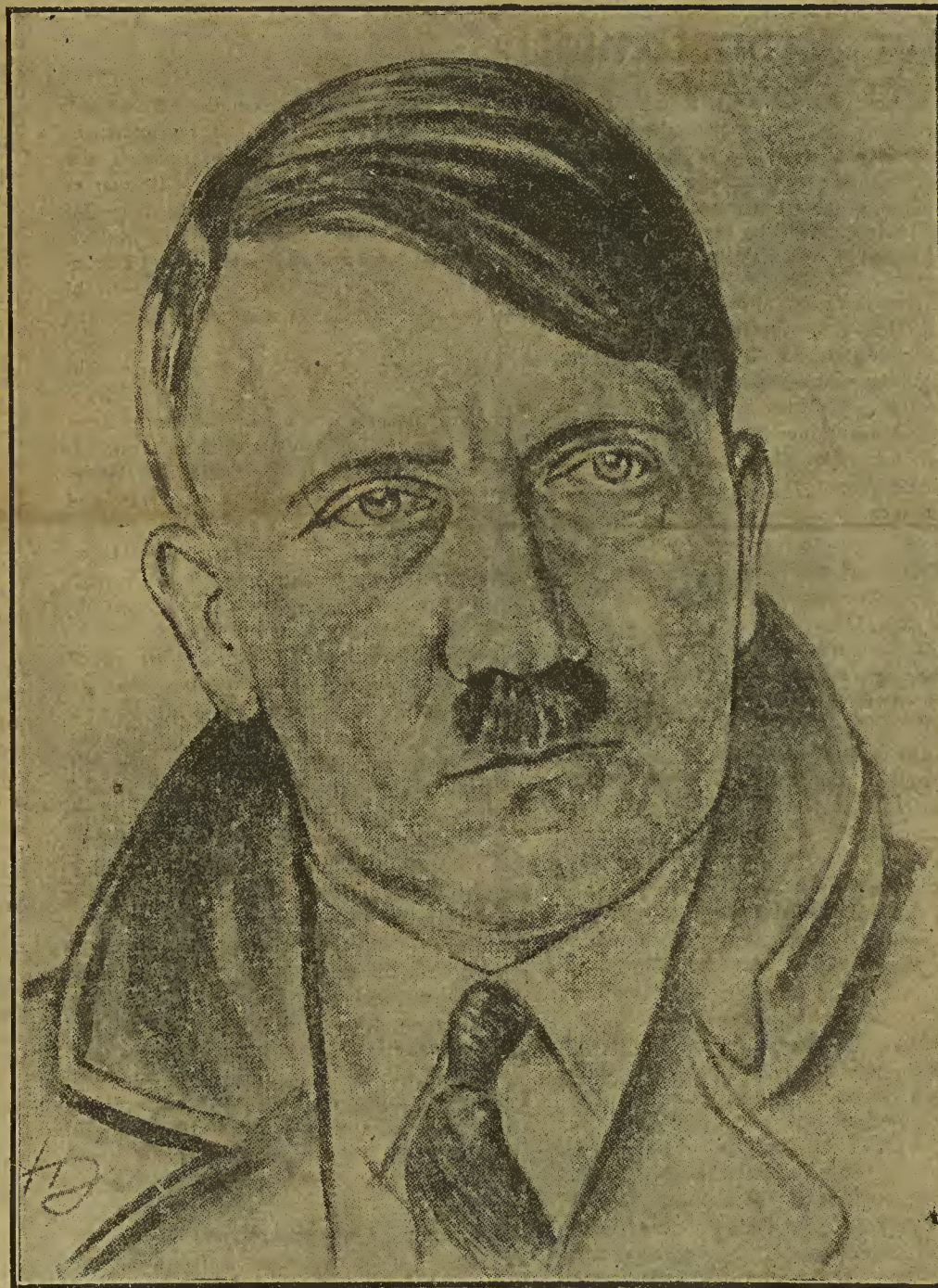
Neueste Zeichnung des Führers von H. Jansen, Dortmund

da priesen sie den Namen des Siegers, den sie noch eben gelästert hatten.