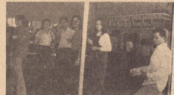
Os bares venderam bem com a demanda de colegiais a Prudente.