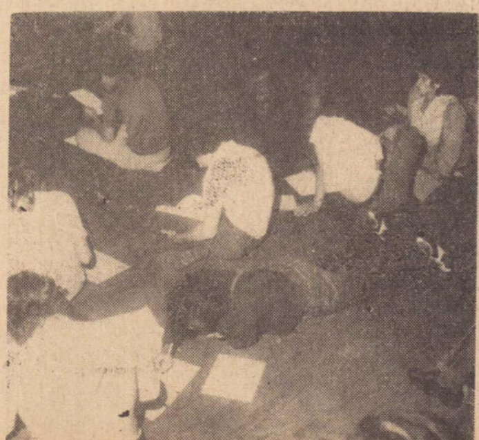
Até deitado, o estudante resolve a difícil questão.

lante, o início do exame, milhares de alunos viviam como se estivessem enfrentando realmente, uma prova de fogo para dar o primeiro passo rumo a uma carreira superior.