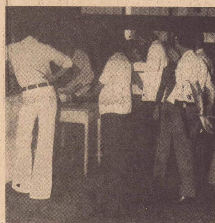
O policiamento foi atuante no local dos exames.

Logo de manhã, ao ser anunciado pelo alto fa-