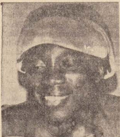
Milton Nascimento, destaque no "Canta Brasil".