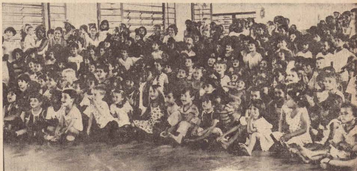
Com toda a movimentação preparada para as crianças, elas passam horas agradáveis aprendendo e se divertindo.

As atividades desenvolvidas são dirigidas pela LBA, com o apoio da administração do CSU Maria Elizabeth Malamam.