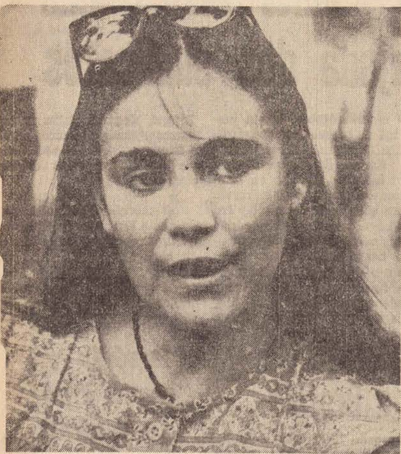
Regina Duarte preferia fazer novela.