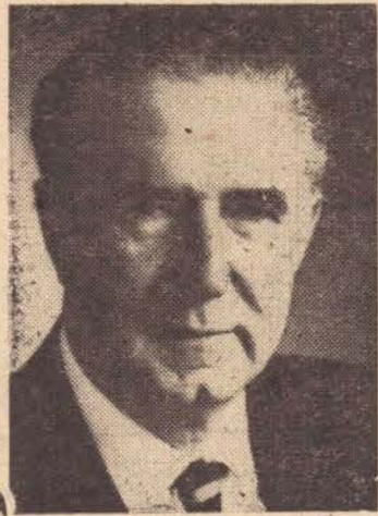
Governador Adhemar de Barros, aprova a vinda do Presidente da Assembleia a Presidente Prudente

estrada que liga Pirapozinho ao Estado do Paraná, bem como a ponte sobre o Rio Pirapozinho, e a estrada P. Prudente a São José do Rio Preto e complementação do trecho da via de comunicações de Adamantina e Presidente Prudente, numa extensão de 60 quilômetros.