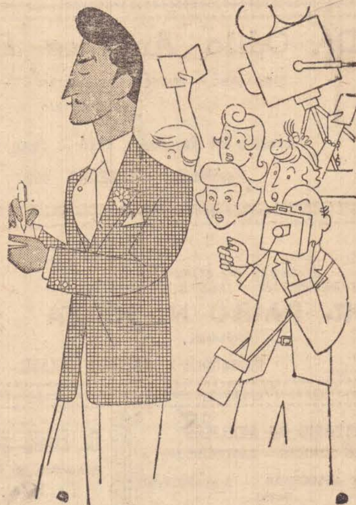
Foto do empresário do irmão do famoso astro do cinema americano, Antony Quin. Segundo suas declarações o Mané Quin estará brevemente numa loja comercial da cidade exposto a visitação.