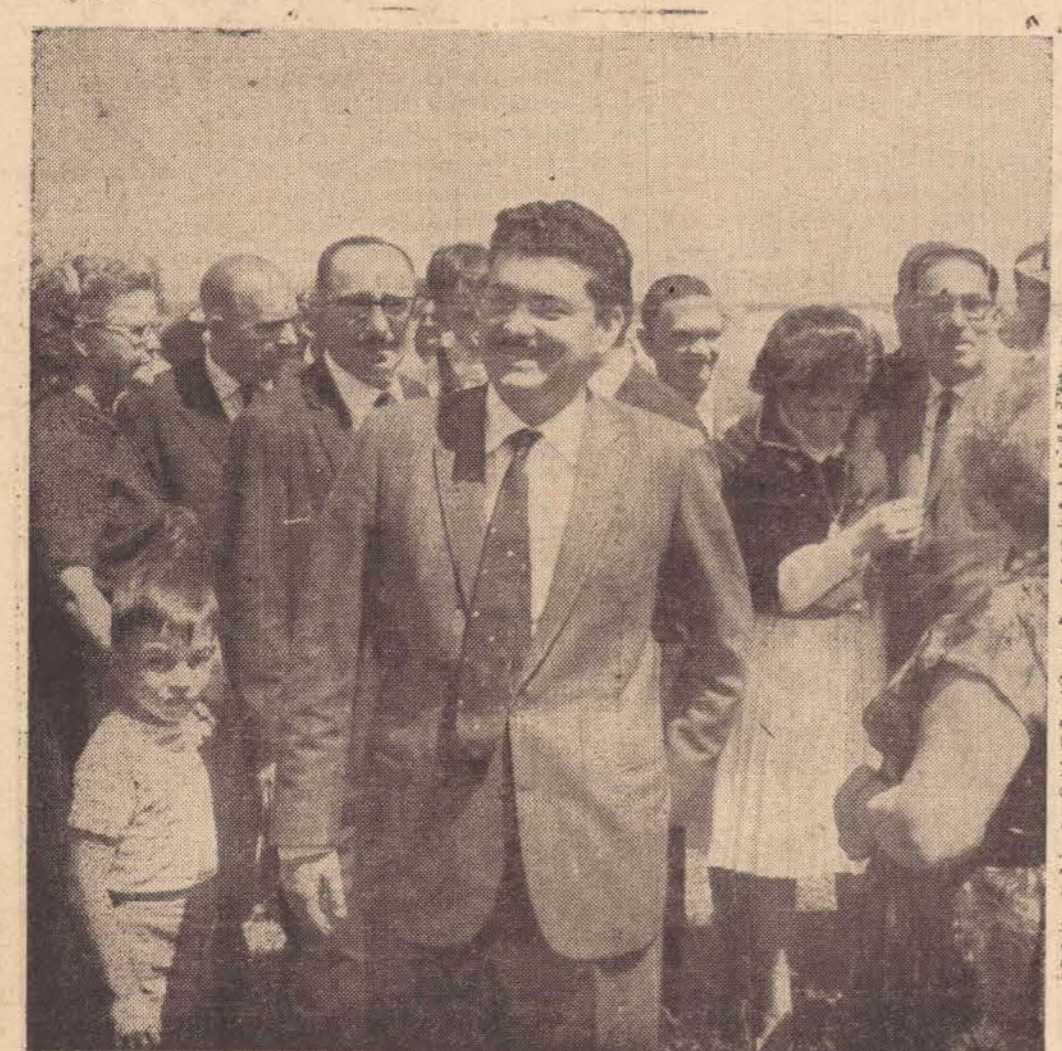
Deputado Cyro Albuquerque, recebe as honras oficiais após a eleição para a Presidência da Assembleia Legislativa do Estado de São Paulo, vê-se ao fundo o Governador Adhemar de Barros.

SÃO PAULO — Sr. Francisco Mangabeira, presidente da Petrobrás, ao regressar ontem ao Rio de Janeiro, declarou que a empresa estatal do petróleo, adquirirá 25 bilhões de dólares em equipamentos a serem fornecidos pelas indústrias paulistas. Esclareceu o presidente da Petrobrás, que a medida além de representar economia de divisas, implicará em incentivo às indústrias nacionais.