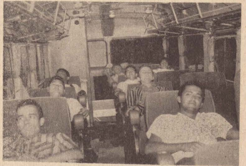
Apenas como demonstração do conforto que o ônibus-leito oferece, ilustramos a notícia com esta foto, onde algumas pessoas posam especialmente para demonstrar ao leitor, toda a comodidade existente.

Ontem foi realizada a viagem inaugural, partindo o ônibus às 23,30 completamente lotado.