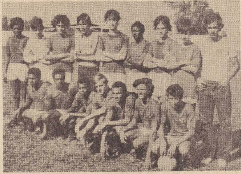
O time campeão — Cruzeiro — do certame juvenil.

O município de Regente seu campeonato de futebol Ju Feijó também promoveu o venil, cujos resultados foram