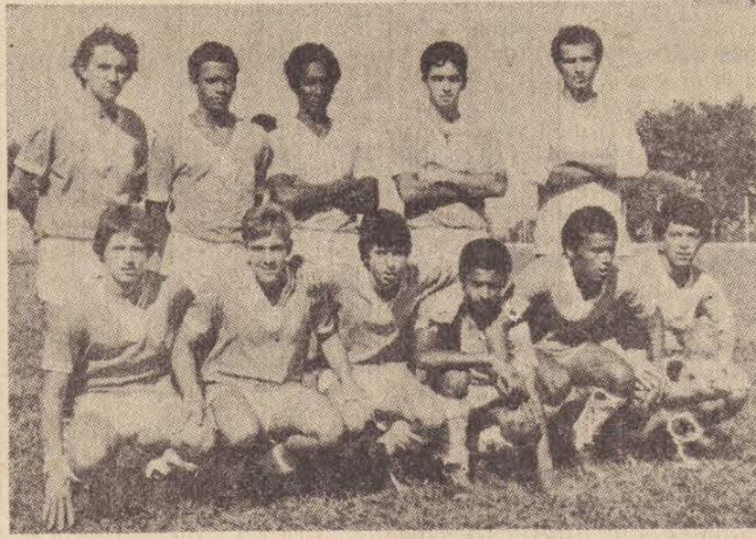
O time vice campeão — Espigão.

apurados no último domingo. A equipe do E.C. Cruzeiro foi a campeã, sendo seguida pela vice C.A. Espigão. Em terceiro lugar ficou a Bandeira F.C. enquanto a equipe da Homeglás ficou na quarta posição.