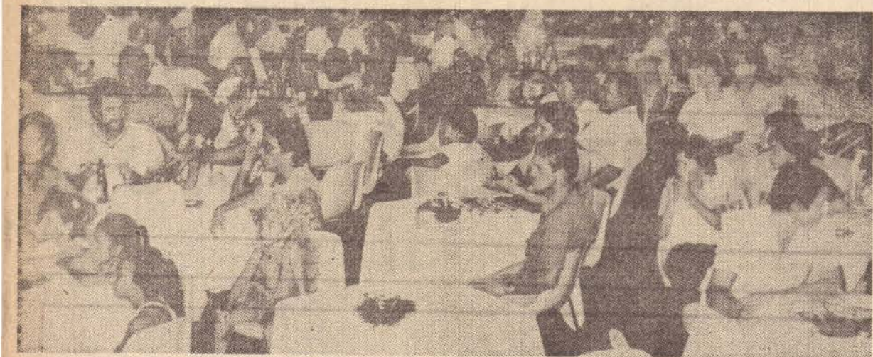
Uma parte da assistência que lotou as dependências do Ten's Clube.