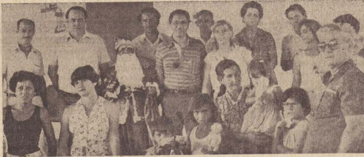
Os elogios a Pres. Prudente, na visita do Coordenador dos Centros Sociais Urbanos do Estado de São Paulo.

A medida adotada ganhou inteiro aplauso ontem no comércio prudentino, pois se queixavam os balconistas e caixas de supermercados que "o Natal havia perdido o sentido" para eles. "Quando chegava em casa — disseram varios deles — a vontade era cair numa cama e tentar descansar. No dia do almoço com a família não havia nem graça, porque nos faltava disposição para festejar o Natal".