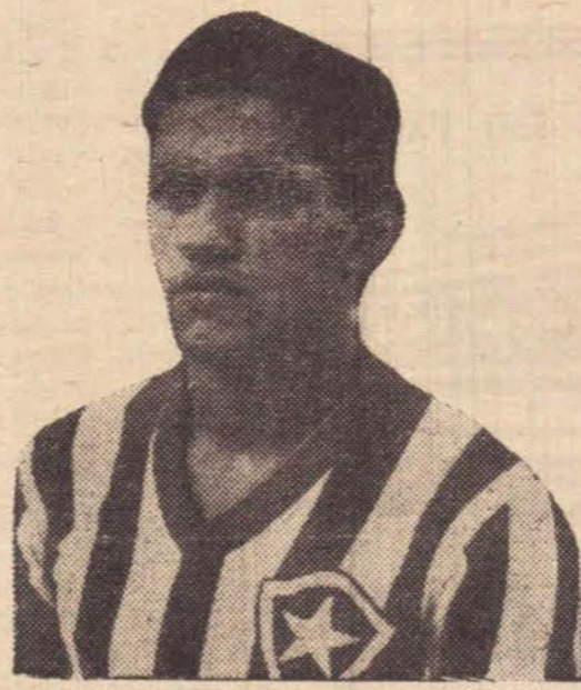
MANÉ GARRINCHA, o ídolo dos cariocas

Ontem às 19 horas, desembarcava no galeão no Rio de Janeiro, o conjunto de Futebol de novos do Brasil, que cumpriu apagada campanha no certame sulamericano de Futebol, que teve o seu termino no último domingo em Coxabamba e La Paz. No seu último compromisso os brasileiros foram derrotados pelos bolivianos campeão do Certame por 5 tentos a 4.