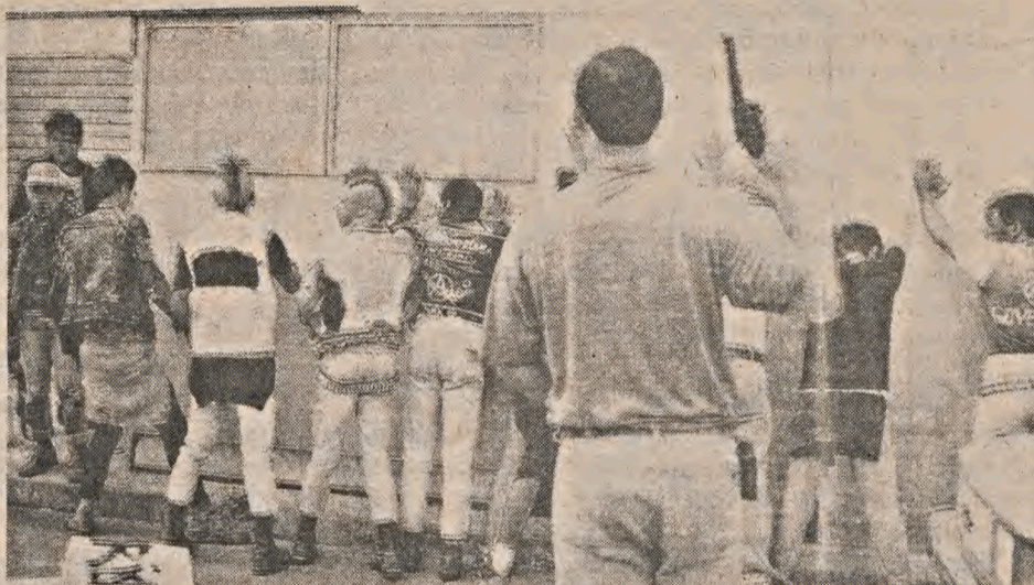
A violência do Estado atinge anarquistas no 7 de setembro

Em uma manifestação tranqüila e criativa, o Movimento Anarquista no Rio, chamou a atenção da população que aproveitava seu feriado na Quinta da Boa Vista. Com bastante material e passando muitas mensagens escritas a giz no asfalto, foram abordados pela população curiosa, que a todo momento parava para conversar.