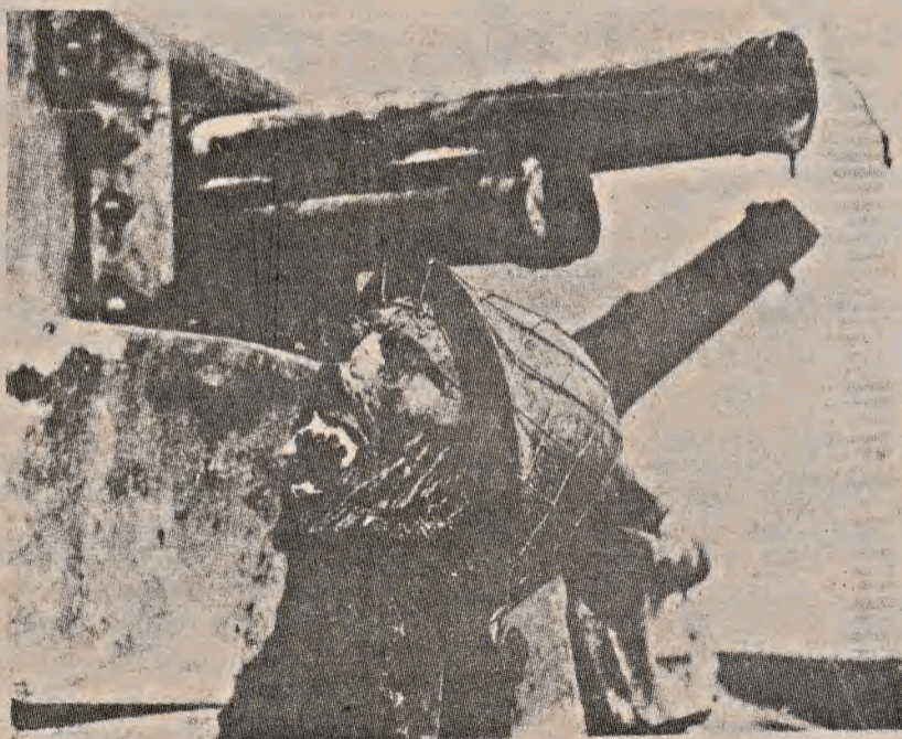
Caveira usada como troféu pelos aliados na 2ª Guerra

Em nossa passeata, deixamos bem claro que somos contra todos os gastos militares e contra o