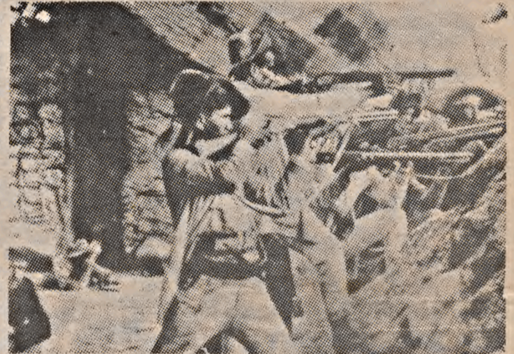
Insurreição camponesa de Canudos

Bóias-Frias - São lavradores que expulsos de suas terras, recebem como trabalhadores assalariados, em trabalhos de empreitada. A designação de Bóias-Frias é porque comem a comida em marmitas que levam para o campo. Há muitos bóias-frias em fazendas de cultura de laranjas, cana-de-açúcar e café. Recebem salários extremamente baixos, daí a quantidade de movimentos reivindicatórios e a formação de sindicatos. Organizam-se a partir das cidades onde habitam. Há a possibilidade desses movimentos expandirem-se num futuro próximo, pois a exploração capitalista no campo tende a ampliar o salarizado, sobretudo nas áreas de industrialização da agricultura.