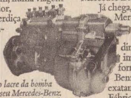
Nunca viole o lacre da bomba injetora do motor do seu Mercedes-Benz. A regulagem da Fábrica é perfeita para dar lucros para você.