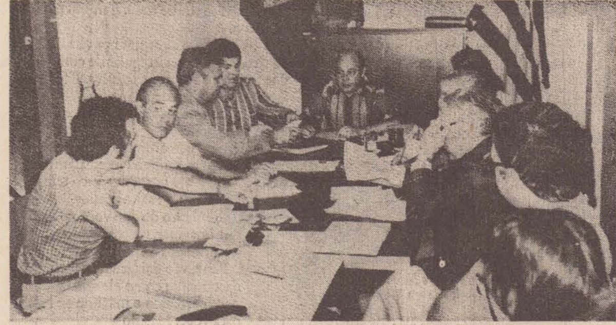
Aspecto da reunião, na sede do Escritório Regional do Interior de S.J. do Rio Preto.