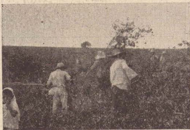
A erradicação de cafezais é uma tática para enfrentar a "ferrugem".