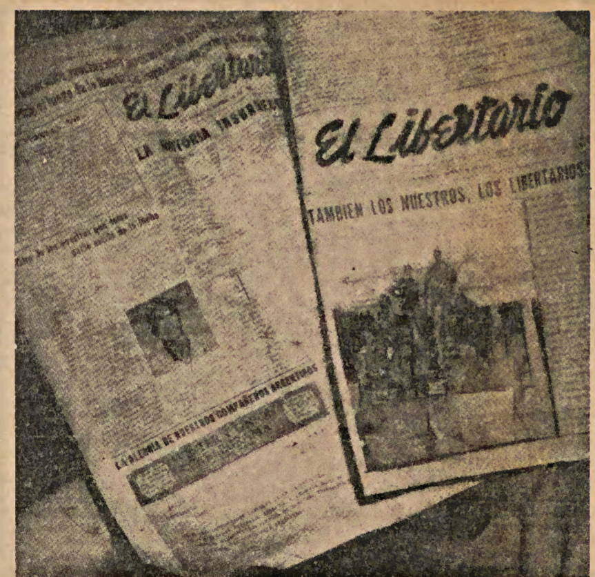
La prensa anarquista en la revolución cubana.