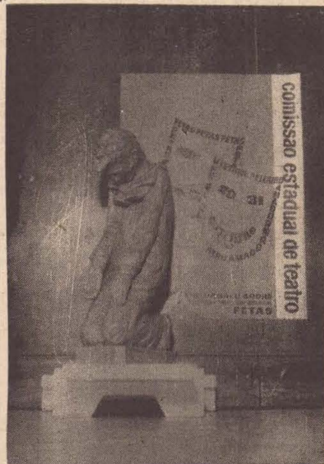
"O Fantoche", Troféu instituído para o V Festival de Teatro Amador do Estado de São Paulo, no presente ano, pela FETAS, ao Primeiro colocado, de posse transitória.

traz conceituações para os tipos de artistas em diversas federações.