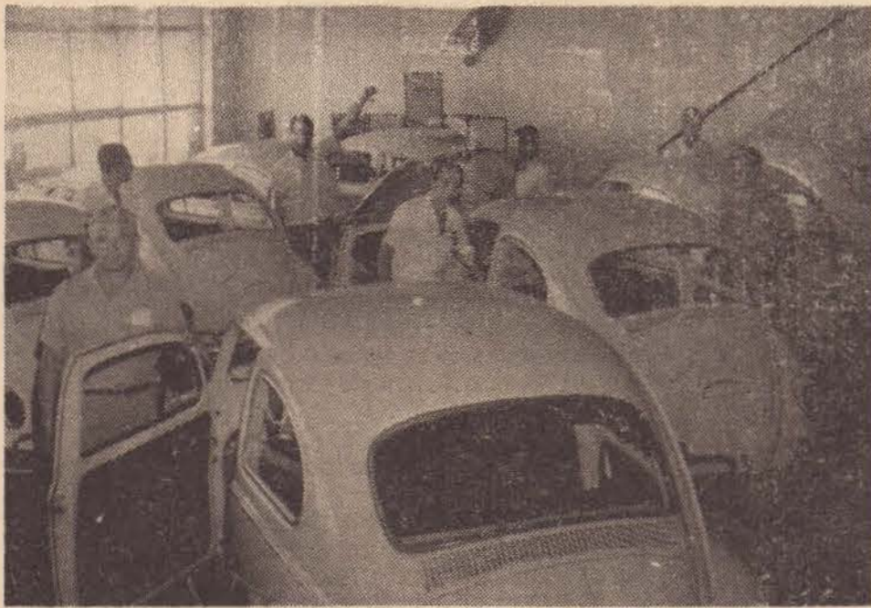
Nosso fotógrafo focalizou o instante em que várias pessoas admiravam as linhas do Sedan Volkswagen, para em seguida manter entendimentos para sua aquisição.

Assim é que, o possuidor de um veículo usado poderá trocá-lo por um novo na Cia. Prudentina de Automóveis, também em condições e facilidades excepcionais. É em razão dessas facilidades e do perfeito atendimento da firma que, diariamente, é intensa a movimentação dentro da mesma, procurando saber detalhes e informações a respeito. Atualmente poucos são os que entram na Cia Prudentina de Automóveis e saem sem o seu veículo, seja, Sedan Karman Ghia ou Perua Kombi.