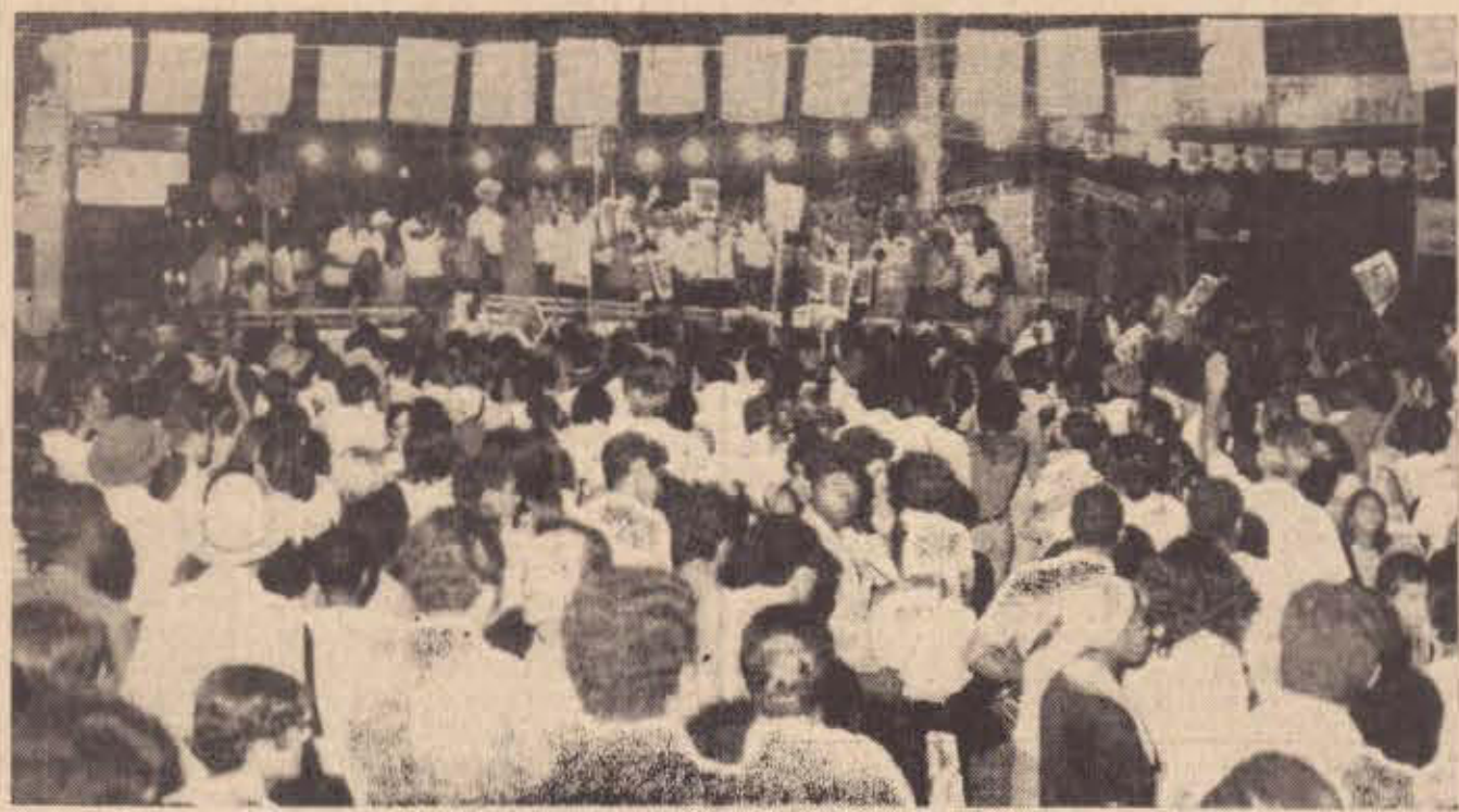
Numeroso público se fez presente ontem ao comício da Arena 1, realizado com pleno êxito na Vila Jesus. Hoje, será a vez da Vila São Pedro.