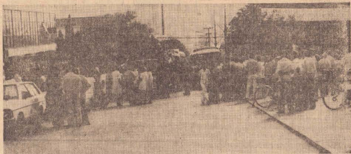
O momento em que o esquife era levado à catedral dos Bombeiros.

Para o Ministro Camilo Penna, os altos índices de inflação brasileira, que "andam em torno dos 50 por cento", se devem a uma série de fatores, mas, principalmente, pela política de desenvolvimento rápido bem sucedida realizada por governos anteriores. Então, reduzir a inflação, para o governo, é um problema ético e um problema prático: "Ético porque a inflação atinge os assalariados e o governo quer cuidar que o salário não seja corroído; prático, porque é preciso desconcentrar tensões sociais". (AE)