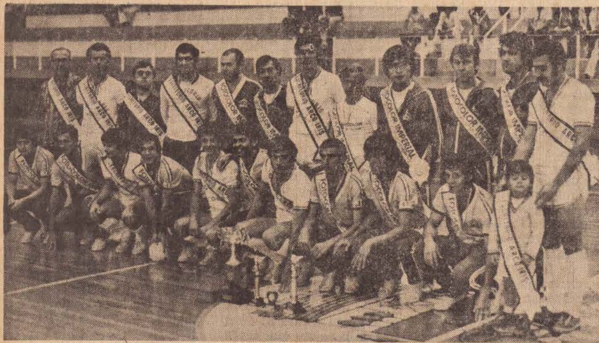
As equipes do Escritório Arco Iris e Fotocolor Imperial, posaram juntas

Tivemos na noite da última quinta-feira no Ginásio Municipal de Esportes, as festividades de encerramento da 3.a Copamepp de Futebol de Salão, promovida pela Autarquia Municipal de Esportes. Durante o cerimonial, foram entregues os troféus e medalhas para as equipes 3.as colocadas da 1.a divisão e divisão especial, troféus e medalhas para as equipes vice campeãs e troféus e medalhas para as equipes campeãs respectivamente, enquanto que as equipes 4.as colocadas receberam através de seus representantes os troféus a que fizeram jus.