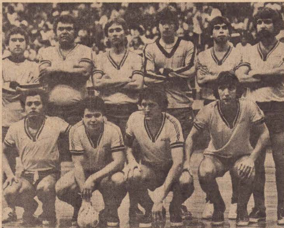
A equipe do Gremac-Brasimac

Na fase de classificação perdeu para o Fotocolor Imperial por 5 a 2 e na final venceu Educação Física duas vezes por 5 a 4 e por 7 a 1.