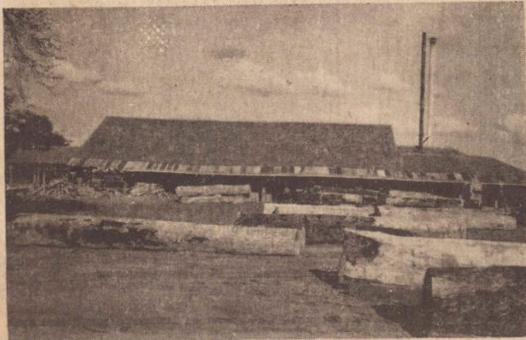
Serrarias como esta, estão ameaçadas de extinção, criando desemprego e sérios reflexos para a economia regional. Sua transferência, para outro Estado, exigiria pelo menos um ano.

Desde as primeiras horas do ano de 1972, a indústria madeireira de São Paulo vem enfrentando nova crise representada pela entrada em que deu nova redação ao Decreto n.º 21, de 28/4/71 mediante o qual "fica proibido o transporte de madeira (aroeira) em qualquer de suas variedades botânicas, beneficiadas ou não, para fora do vigor do Decreto n.º 49, de 24 de maio de 1971, Estado" de Mato Grosso.