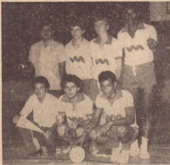
Na foto a equipe vencedora