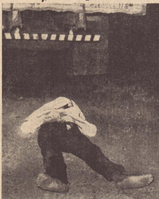
Os corpos das vítimas, ficaram a beira da pista asfáltica, sendo liberados de madrugada pela Polícia Técnica