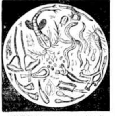
MICROBIOS da agua impura destruidos pelo ALCAIÃO de GUYOT. Um pouco de alcairão O alcairão é um antiseptico de primeira ordem. Mata os microbios, causa

Meio de sanear a agua consiste em deitar n'ella