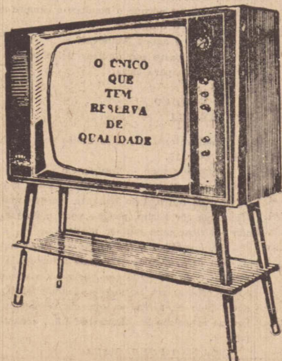
Imagem e som de presença total, com Reserva de Qualidade.