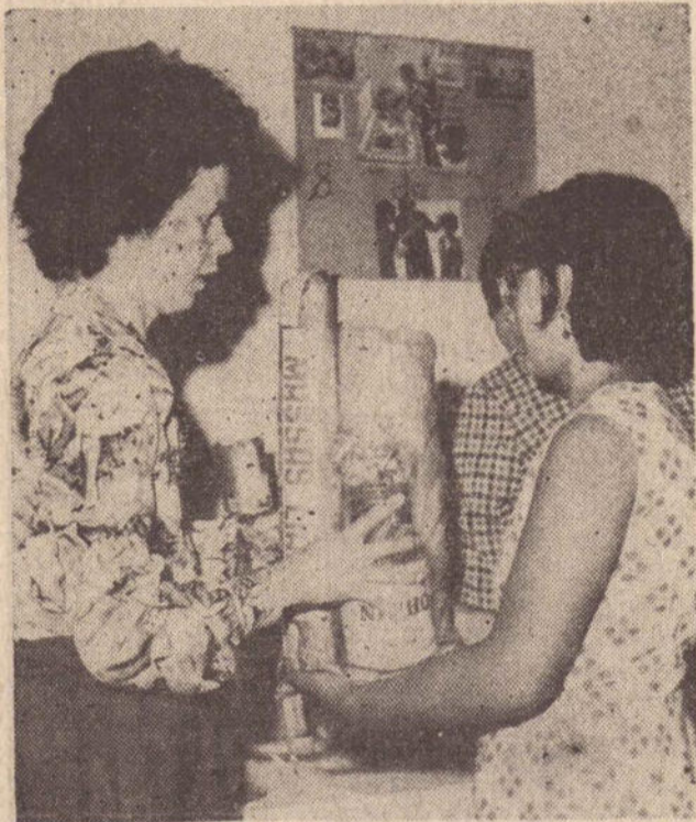
Todas as mães presentes receberam pacotes de gêneros alimentícios.