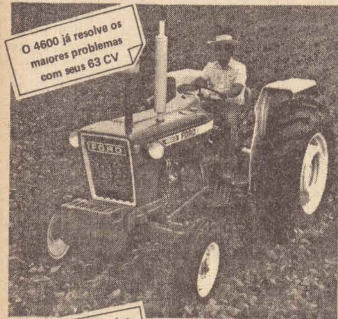
O 4600 já resolve os maiores problemas com seus 63 CV