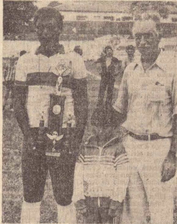
Troféu Benedito Aparecido P. do Lago, entregue ao Capitão da Associação dos Servidores Municipais