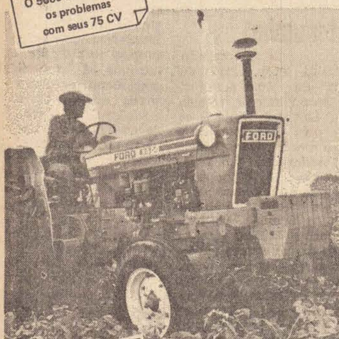
O 5600 resolve todos os problemas com seus 75 CV