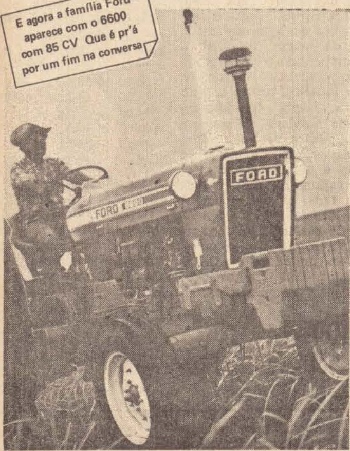
E agora a família Ford aparece com o 6600 com 85 CV. Que é prá por um fim na conversa