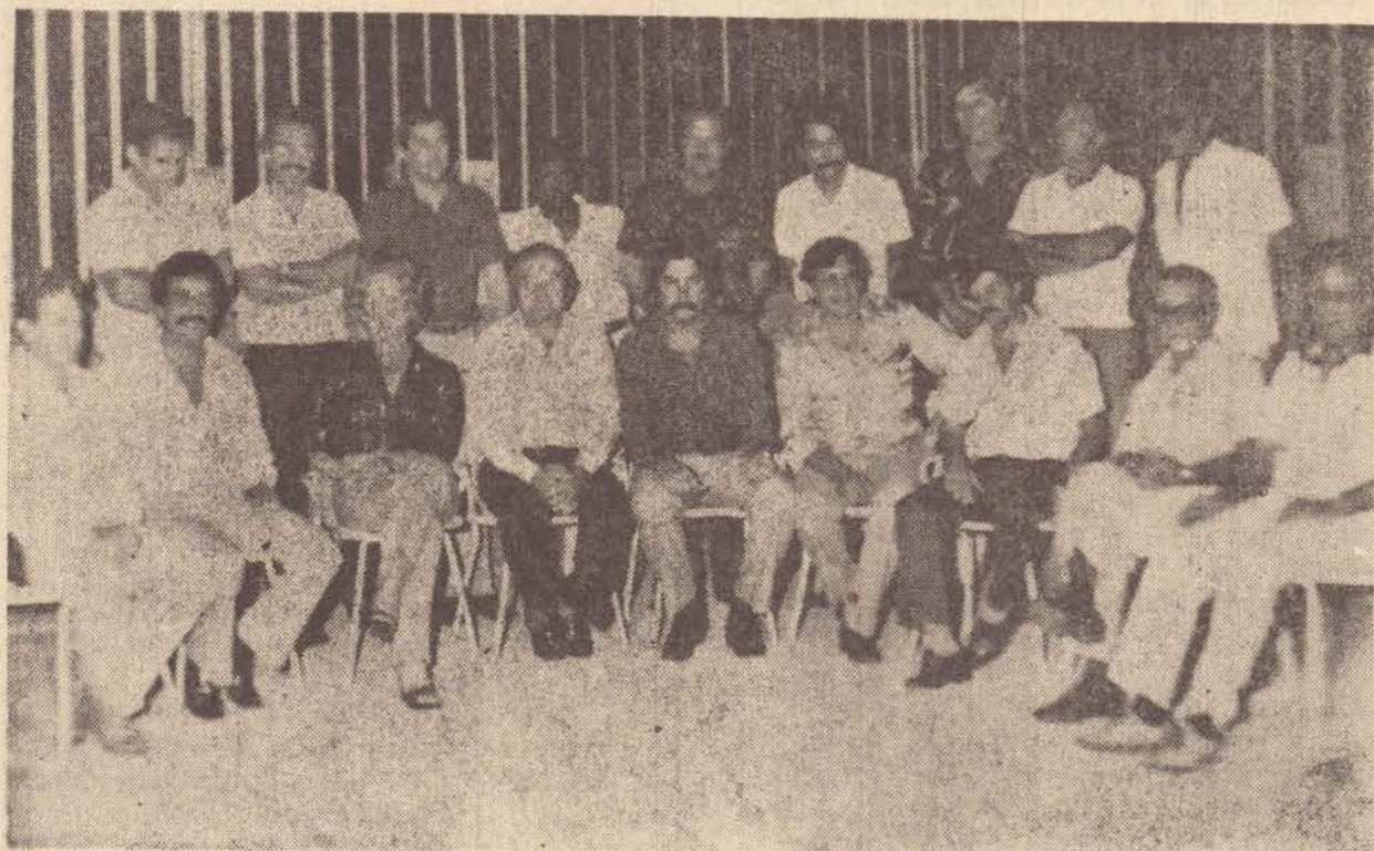
No Aruá Hotel, a confraternização para o aperitivo.